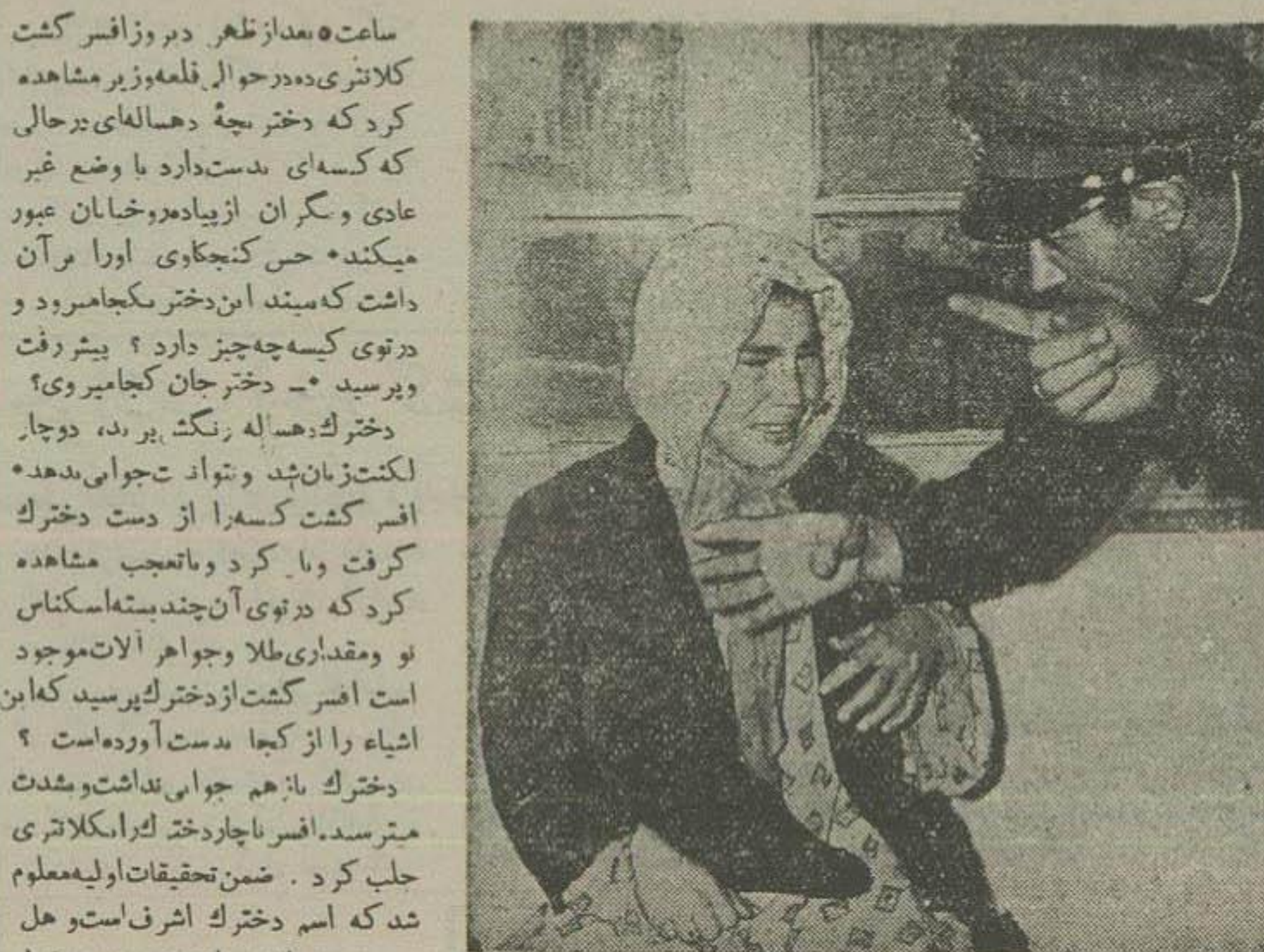
بگو که چه کسی ترا تحریک کرده است!