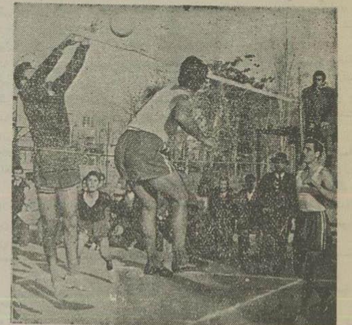
لحظه از مسابقات نهائی والیبال کارگران کارخانجات تهران

یروز صبح آقای دکتر سرور وزیر کار و آقای مهندس گروگان مدس کلرام آهن برای تشریح ورزشکاران و همچنین بمناسبت آخرین مسابقه والیبال کارگران کارخانجات در زمین ورزش راه آهن حضور یافتند.