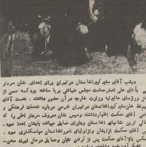
دیشب آقای سفیر کیرانفانستان در تهران برای اهدای نشان سردار اعلی پادشاهی به اعضای هیئت مدیره شرکت نفت ایران و انگلیس در مجلس شورای ملی

هنوز جنک در حوالی کاسونگ ادامه دارد تلاش برای پیدا کردن نخست وزیر مفقود سیام - آسوشیئد پرس - نیروهای نظامی سیام شدیداً بنیروی دریائی آن کشور حمله برده و ببرد سستی بین این قوادر گرفته است.