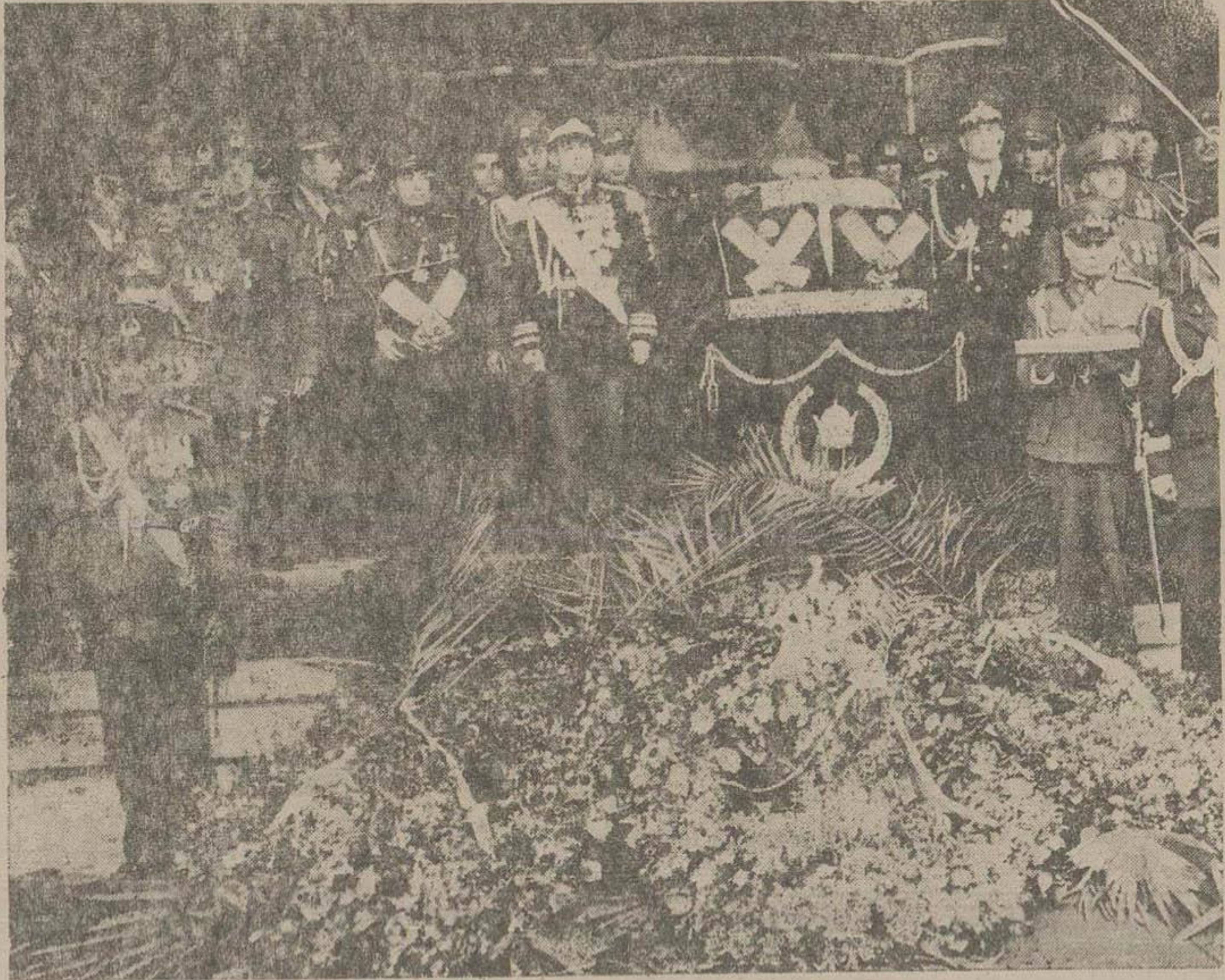
جنازه بر روی جابده مخصوصی که سیاه پوش و بانای پهلوی مزین شده بود جلوی در بزرگ ایستگاه راه آهن گذارده شد و با تشریفات کثرت فرستند و با تشریفات که در بالا دیده میشود واحدهای ارتش و سربازان کشورهای ۸ سوار از مقابل جنازه گذشتند و احترامات نظامی به آن آوردند .

گذشتند و نوبت برژه واحدهای ارتش کشورهای همجوار رسید . سربازان رشید واحدهای ارتش همسایگان بترتیب اول افغانستان ، سپس ارتش ترکیه و بعد ارتش عراق با ادای احترامات از برابر جنازه شاهنشاه قید گذشتند .