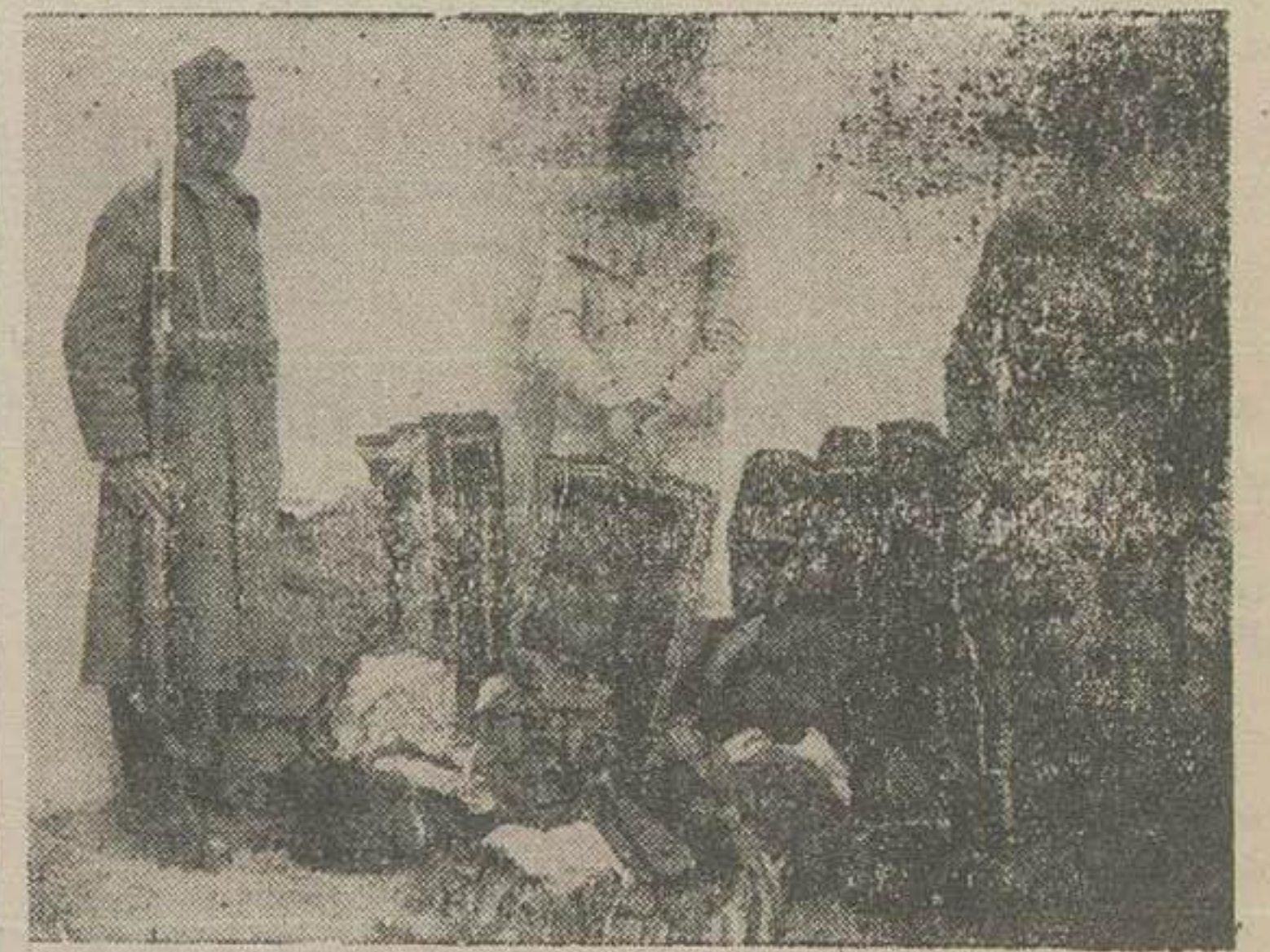
حضرت سارق معروف پس از دستگیری