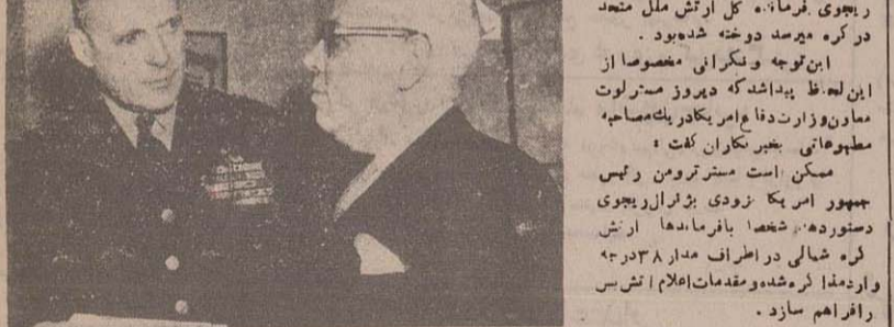
ژنرال ریجوی فرمانده ارتش ملل متحده با ادوارد و سفیر کبیر دولت چین چند روز قبل درباره موضوع آتش بس در کره مذاکره کرد

چین کمونیست هم با اعلام فرمان آتش بس در کره موافقت کرد