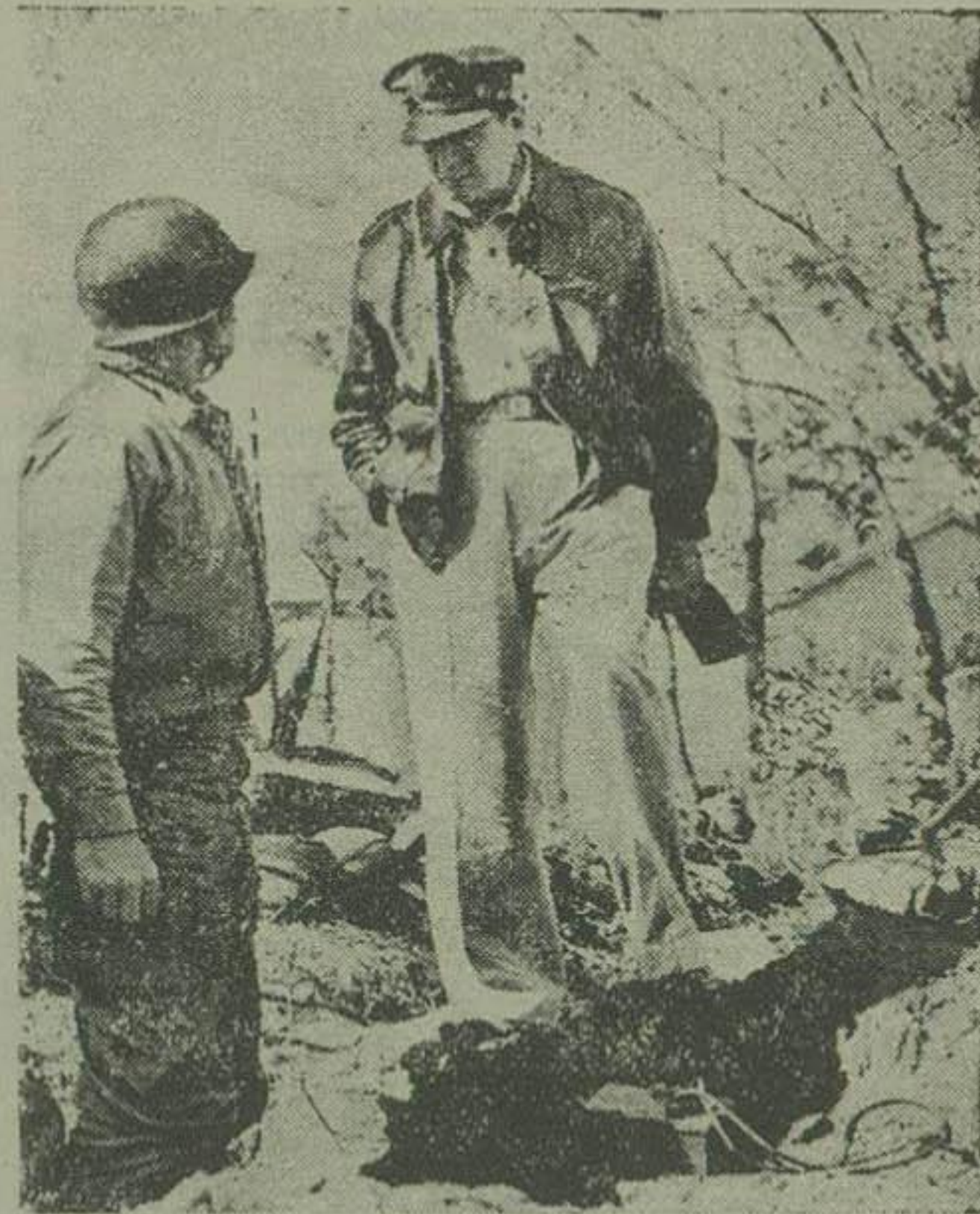
ژنرال ماک ارتو در بازدید پشیراز جبهه های جنگ شخصاً بایکی از تفنگداران امریکائی در حین عملیات در باره چگونگی فعالیت وی گفتگو کرد

خبر تکاریونایتدریس اطلاع می دهد در وزعه ای از نواحی کره شمالی که در اردوگاههای لشکر کره شمالی در زندان بسر میبردند آزاد شده و بتقاط پست جبهه انتقال داده شدند.