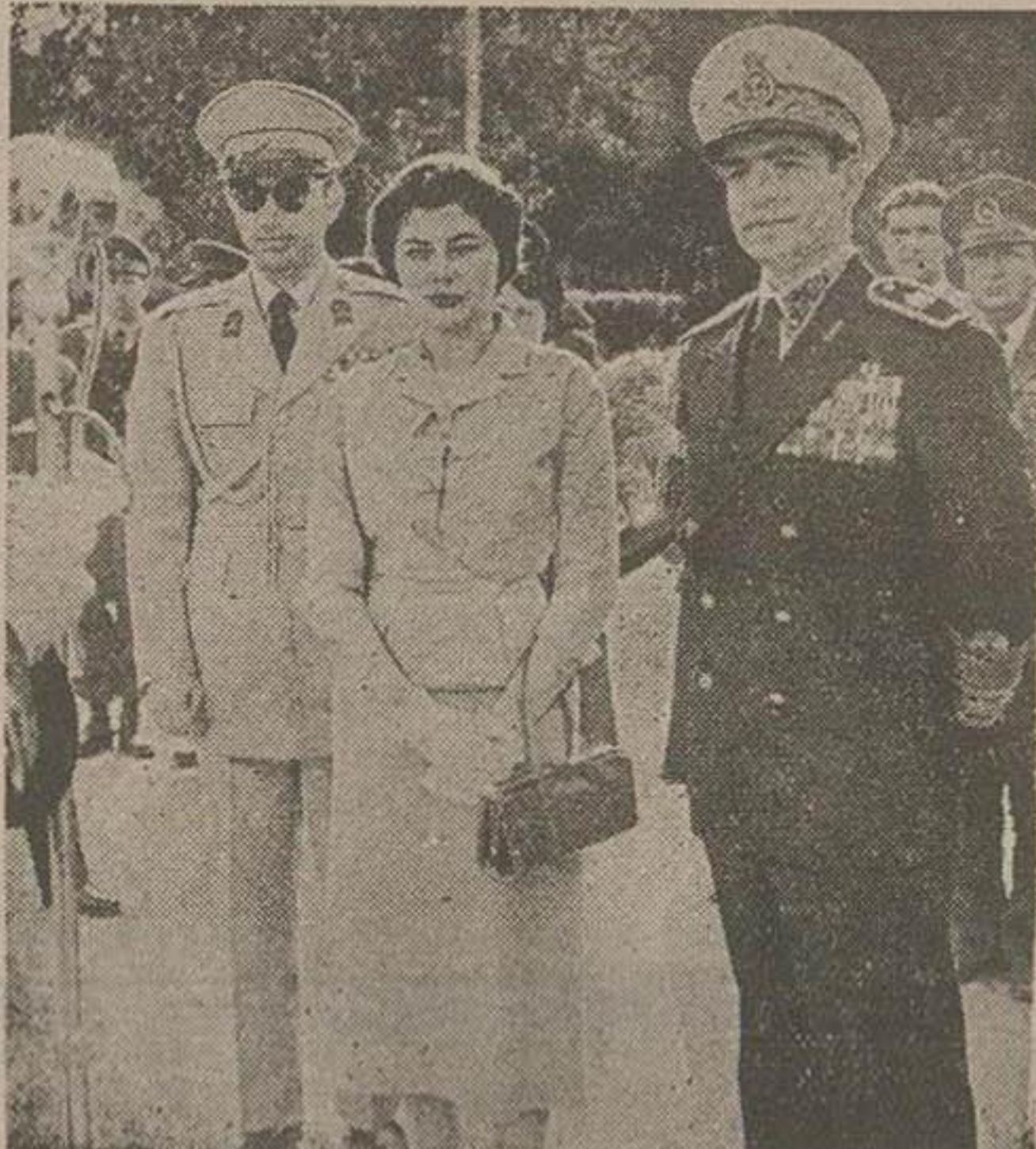
در عکس بالا اعلیحضرت همایونی و اعلیحضرت ملکه نریا در شهر آبادان دیده می‌شوند، والا حضرت شاهپور غلامرضا پهلوی نیز شرفیاب می‌شوند

ملل خاورمیانه و مخصوصا مصر باید توجه داشته باشند که کشور اسرائیل با قراردادی که اخیرا بین ترکیه و عراق منعقد شده است با شدت مخالفت است زیرا دنیای غرب دیر یار و دیر پیوسته خواهد شد مرای حفظ منافع خود در خاورمیانه بین کشورهای عربی و اسرائیل یکی را انتخاب کرده و با آن همکاری بکنند و پرواضح است قدرت کشورهای عربی هر چه زیادتر باشد احتیال اینکه کشورهای عربی با اعراب همکاری بکنند بیشتر است