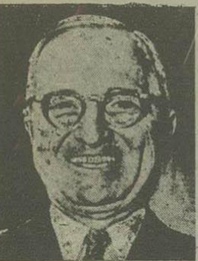
مستر ترومن رئیس جمهور امریکا

دی پس از اشاره به موضوع تهاجم نیروی کمونیست بخاک کره گفت: ایران از کشورهایی است که باید کمک مؤثر دریافت نماید مستر ترومن معتقد است برای جلوگیری از نفوذ کمونیسم باید ملل آزاد جهان مجبور شوند