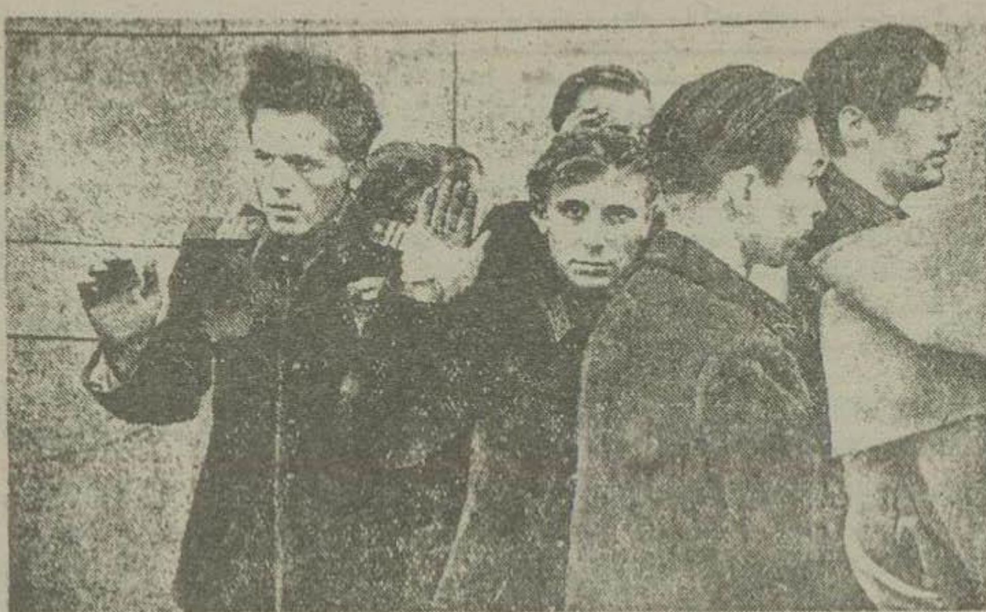
افراد خائنکار پلیس مجارستان بوسیله انقلابیون آن کشور تسلیم شده‌اند