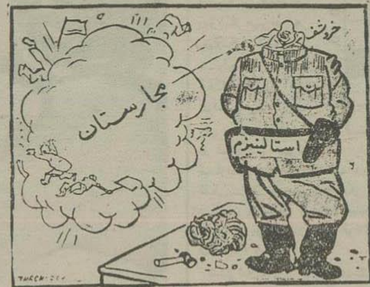
تجدید حیات؟ انقلابیون گرسنه و پرهنه هنوز می جنگند

ارتش سرخ حمله نامنه داری به آخرین مرکز مقاومت انقلابیون در جزیره شیل بوداپست شروع نمود هنوز انقلابیون گرسنه و پرهنه مجار، بدون اینکه سلاح کافی داشته میجنگند تعداد افراد انقلابی و ارتش سرخ به نسبت یک بر بیست است