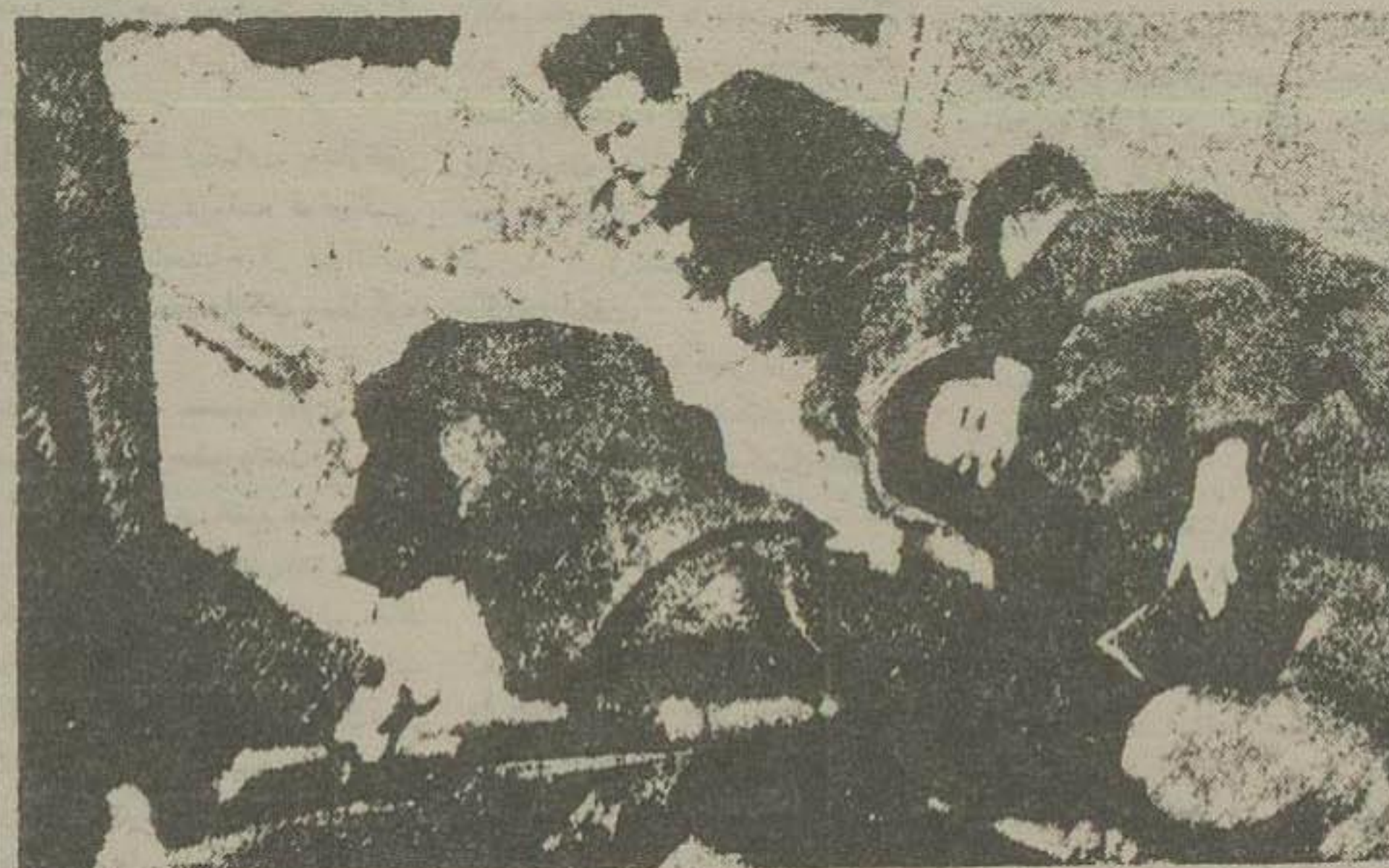
دانشجویان خائنکار پس از عمل خود را در برابر دانشگاه دیده مشغول شمشیر زنی شدند