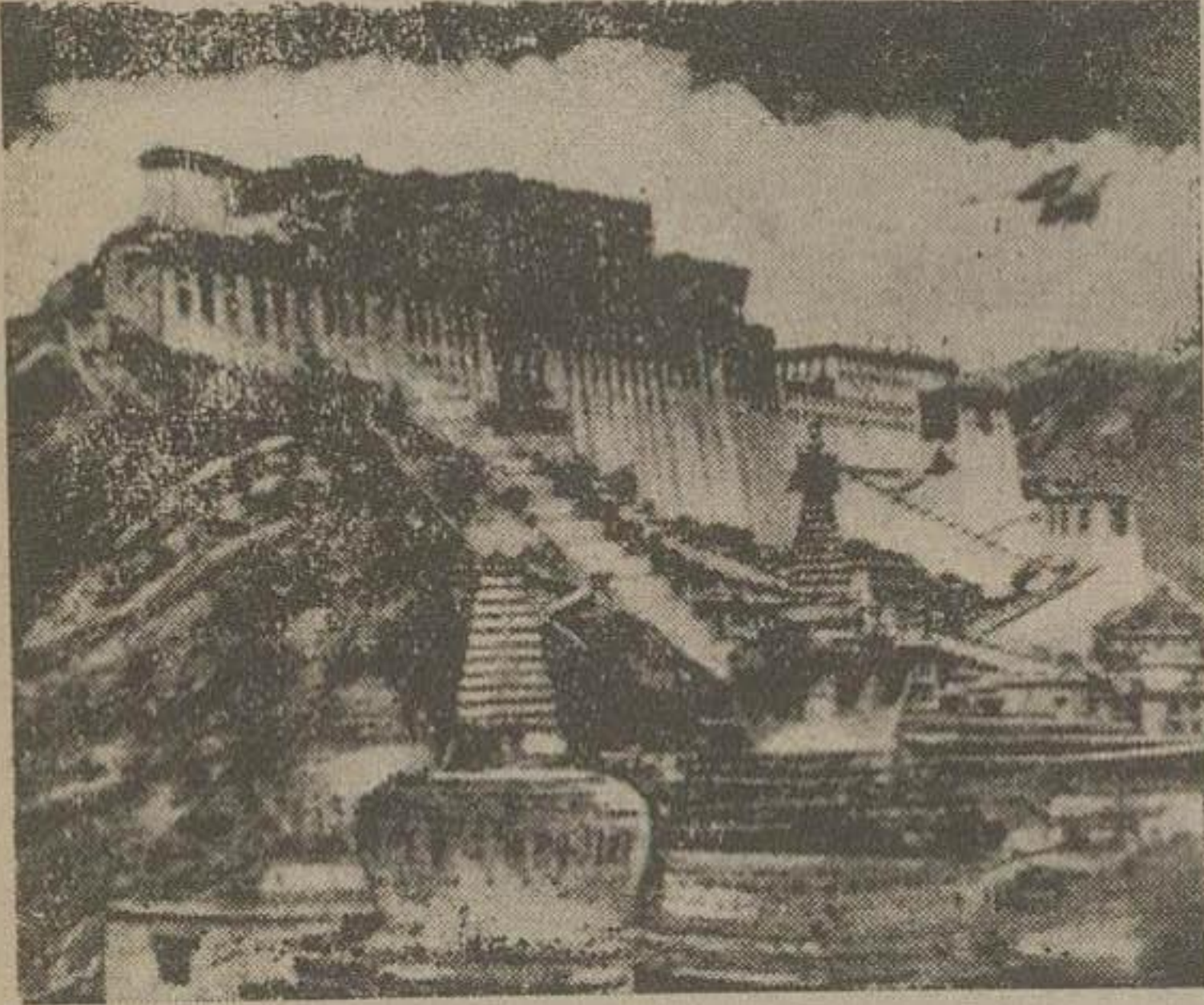
جمله «نیوزویک» چاپ نیویورک که امروز در سراسر امریکا انتشار می یابد عکس بالا را که تازه ترین وضم شهر لهاسا را نشان میدهد چاپ کرده است

دلهی جدید - اسوشیتد پرس - امروز سخنگوی وزارت خارجه هندوستان اظهار داشت آخرین خبری که از شهر لهاسا پایتخت تبت بدلهی جدید واصل شده حاکیست که نیروهای ارتش چین کویت در پشت دروازه های شهر لهاسا که دارای حصار بسیار بلندی است توقف کرده اند. بقر اخباری که از شهر مرزی کالیپوک رسیده ترف سربازان چین کمیونست در نزدیکی شهر لهاسا و ضعیف پیدا کرده که غالباً شناسا حدس میزنند ستاد فرماندهی نیروهای چین قصد دارد اهل شهر خود را تسلیم کرده و از حمله و هجوم بشهر خودداری شود. همچنین گفته میشود فرماندهی چین کویست می خواهد در مدت توقف در فاصله شهر (لهاسا) از فعالیت سون پنجم در داخله شهر استفاده کرده و پس اطمینان از تسلیم شهر نیروی خود را به قطعه دیگری انتقال دهد. همان منتهی اضافه میکند احتمال می رود وصول به داداش دولت هندوستان بپیک تصمیم دولت چین کمیونست را تقبیردهد. همین جهت اطلاع ناوای ارتش خود را در نزدیکی لهاسا متوقف ساخته است. خبرنگار یونایتد پرس از دلهی اطلاع میدهد از قرار گزارش واصله از دسین ها که نماینده دولت هندوستان در لهاسا نیروهای چین پس از تصرف شهر «شامو» ستون اصلی نیروهای خود را روانه شهر «یویو» واقع در مرز کشور تپال کرده اند.