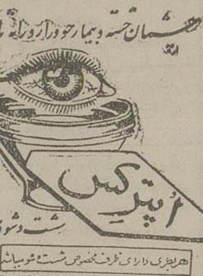
بهریاری درای نور چشمی شست و شویش