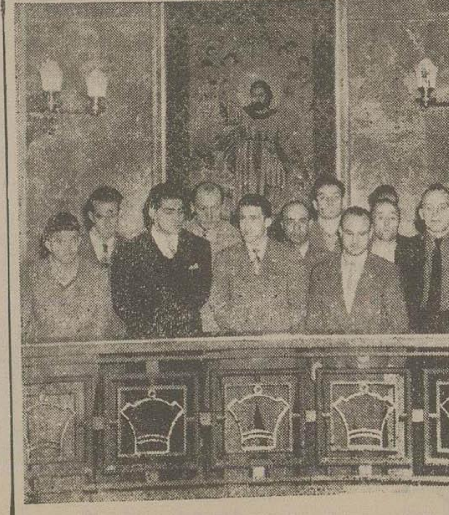
پانزدهمین روز و روز شکاران ایتالیائی بر آرماتگه شاهنشاه فقید دیده کلی گذاشتند.