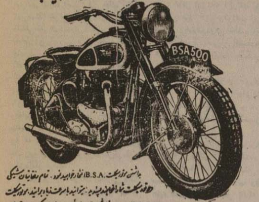
باشن موتور بیکت B.S.A. نمازید. نام نمایان بیکت موتور بیکت بی. اس. ال. دریا شهرت برائی دارد. این موتور بیکت بی. اس. ال. دریا شهرت برائی دارد. این موتور بیکت بی. اس. ال. دریا شهرت برائی دارد.

جبهه غربی از هر جهت رضایت بخش بود و ظن غالب اینست که کلوه باران چند ساعتی در تمام آن ها خسارات زیاد هم از جهت سرباز وهم از جهت مهبات و تسلیمات بکونیست ها وارد آورده باشد. اعلامیه امروز با مدهاد ستاد واحد پنجم نیروی هوایی ملل متحد در کره حاکی از آنستکه دیش هواپیماهای جنگی و باران واحد پنجم به است ماوریتی که در حفاظت و پشتیبانی از حملات پیاده نظام ارتش ملل متحد در کره داده شد پس از آن کمونیست را به مسلسل بسته و طی حملات خود واگذاشتند بیش از سیصد تن از آنها را پای در آوردند.