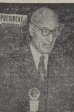
آقای دکتر محمد علی ملکی وزیر سابق بهداشتی و رئیس هیئت نمایندگی دولت ایران در مجمع سازمان بهداشت جهانی دوساعت نیم بعد از ظهر دیروز از ژنو بهرین مراجعت نمود، وی عصر دیروز آقای نخست وزیر را ملاقات کرد و گزارشی از جریان ماموریت خویش و مسائلی که در مجمع مطرح شده بود با اطلاع ایشان رساند آقای ترمه حلی در مصاحبه ای به خبرنگار ماصبح امروز بامشاریه بعمل آورد اظهار داشت. دستور جلسات سازمان شامل دوست بود بیکسخت فنی و یکسخت اداری کیسیونهای اداری مسئول تهیه بوده و تقسیم آن بر حسب احتیاج هر ملکت عضو سازمان بحدود در نظر بقیه در صحنه هفتم

از اقدامات نماینده دولت انگلیس در سازمان بهداشت جهانی مبنی بر دعوی تحت الحماگی بحرین جلوی گیری بعمل آمد کمکهای سازمان بهداشت بدولت ایران در سالیهای جاری و آینده چه میزان خواهد بود