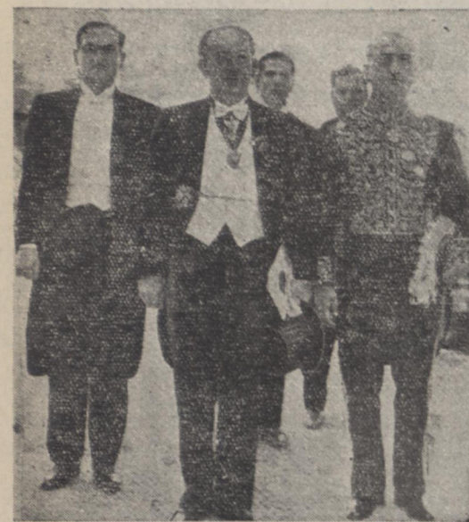
آقای بهاء الدین نوری سفیر کبیر عراق با تفاق آقایان میکده رئیس تشریفات و وزارت خارجه و دبیر سفارت عراق قبل از تشریفات برای تقدیم استوار نامه ساعت ۹ و نیم صبح امروز اعلیحضرت همایونی با هوایی اختصاصی از رامسر بهرین وارد شدند و یکسمر از فرودگاه بکاخ سمد آباد رفتند آقای بقیه در صحنه هفتم

استاندار فارس بمعاونت وزارت کشور و کفیل وزارت بهداری با ستانداری فارس معرفی شدند شاه پس از ورود بهر آبادان یکسمر بسمد آباد فریتم فرمود سفیر کبیر عراق استوار نامه خود را بتشریفات خاص حضور اعلیحضرت همایونی تقدیم نمود