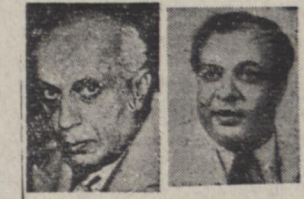
محمد علی نوری - وزیر نفت

واشنگتن - یونایتد پرس امروز دولت امریکا رسا اعلام کرده که از فروش نفت و سوخت بکشتیهائی که به بنادر و شهرهای چین کمونیست رفت و آمد میکنند خودداری خواهد نمود. محافل بازرگانی واشنگتن امروز در تمیق این اعلامیه خاطر نشان ساختند که این عمل در تنگ کردن حلقه محاصره ای که از طرف امریکا بچین کمونیست اعمال میشود کمک فراوانی خواهد نمود. دوماه قبل ماهیانه ۵۰ کشتی و ۶۰ هواپیما چین کمونیست رفت و آمد میکردند و حال آنکه در ماه گذشته فقط سه کشتی کوچک و دو هواپیما به بنادر آن کشور وارد شده اند و احتمال می رود در ماه جاری این رفت و آمدها بکلی متوقف و رابطه بازرگانی چین با دنیای خارج قطع گردد.