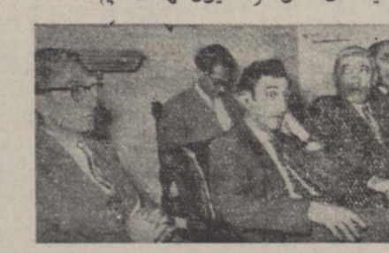
امروز عده ای از بازرگانان و نمایندگان اصناف با نمایندگان عضو فراکسیون نهضت ملی.