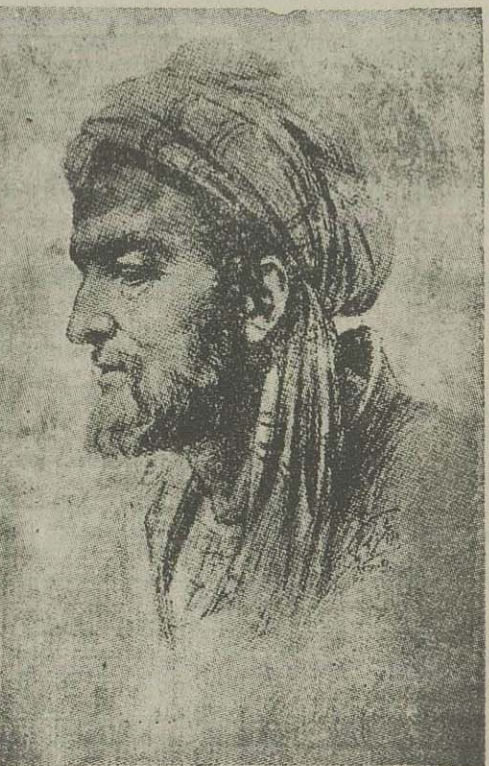
این تصویر را صدیقی استاد هنرمند از ابن سینا ساخته است. مدرك تهیه آن قدیمترین تصویر است که از ابن سینا در دانه کشده برکتی پاریس موجود است و از تومیسفاتی که در پاره ای از کتب قدیمی درباره خصوصیات قیافه ابن سینا ذکر شده نیز در تهیه این تصویر استفاده شده است.

در پاسخ این سؤال که آیا از مراجعت پرودم تهران اطلاع وصی بدولت رسیده است یا خیر آقای وزیر کشاورزی گفت یک خبر تیره سری در این باب بدولت رسیده است. در خصوص بازگشت کارتر بلندن به تهران صورتیکه مسائل مهمی در پیش باشد که حضور شخص ایشان را در تهران ایجاد نماید البته باین مسافرت مبادرت خواهد شد. ولی اگر مطالبی که در مذاکرات آینده مطرح میشود حائز اهمیت زیادی نباشد و اتخاذ تصمیم در باره آنها در حدود اختیارات نمایندگان بانک مقیم تهران باشد، در ایصورت مسافرت کارتر لزومی نخواهد داشت. دوفتر نمایندگان بانک بین المللی که برای گردش و بازدید آثار تاریخی اصفهان، سه روز قبیل بان شهر مسافرت نموده بودند قراردادت امروز عصر بتهران مراجعت نمایند.