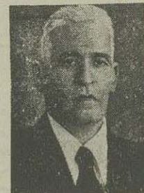
آقای دکتر غنی