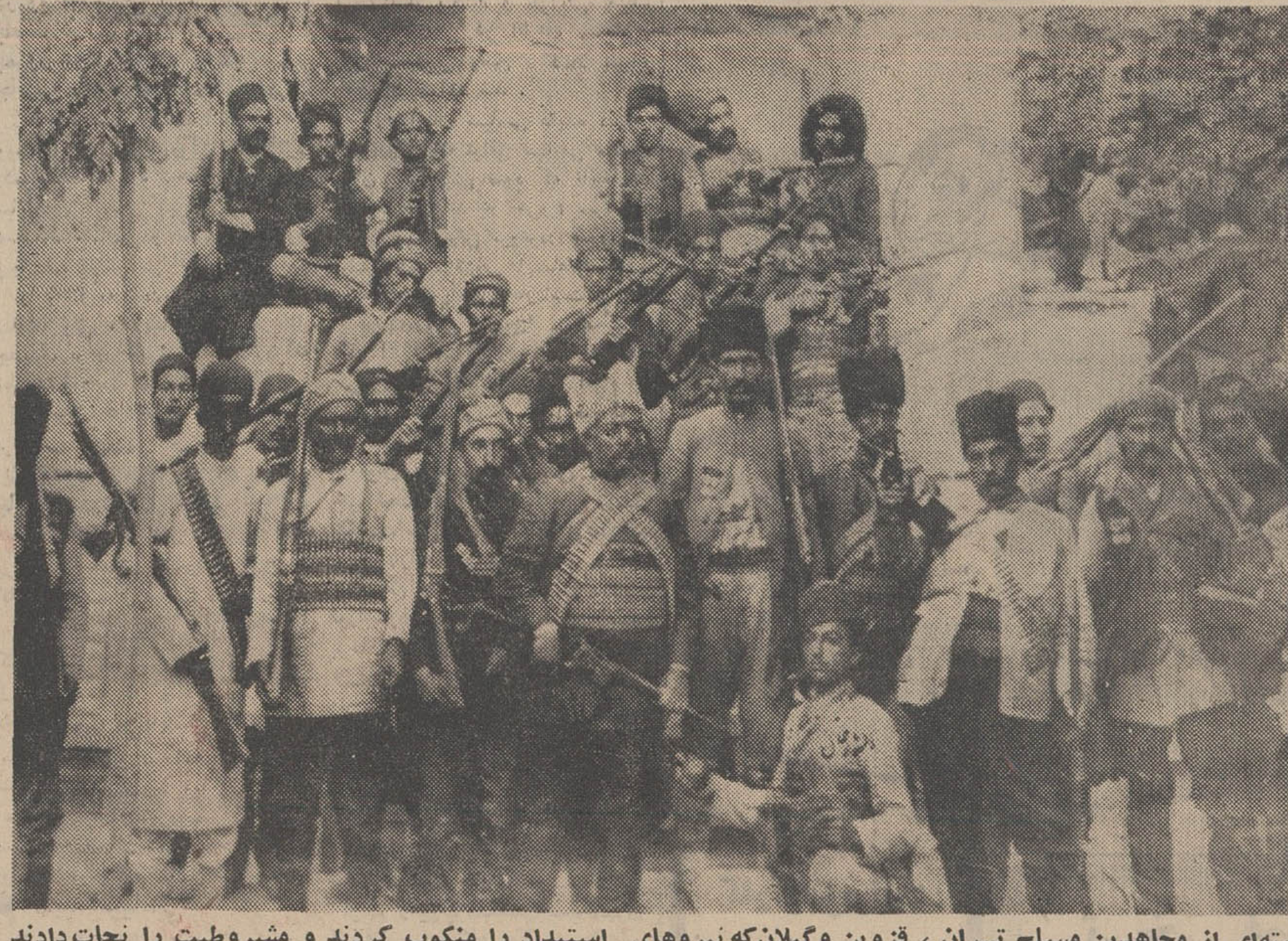
دستهای از مجاهدین مسلح تهران، قزوین و گیلان که نیروهای استبداد را منکوب کردند و مشروطیت را نجات دادند

بود در تاریکی شب خود با مجلس رسانیدند. در آن روزها که مشروطیت و آزادی در برابر استبداد و بیسده گری قرار گرفته بود اطراف بهارستان سنگربندی شده بود روز ۲۳ عده مجاهدین محدود شمسند نفر رسید که در سنگر های خود جای گرفته بودند و همینکه شب شد عده ای برای تکبیهاتی باقی ماندند و بقیه بمنازل خود مراجعت کردند موقع شروع جنگ عده کمی توانستند به مجلس مراجعت کنند.