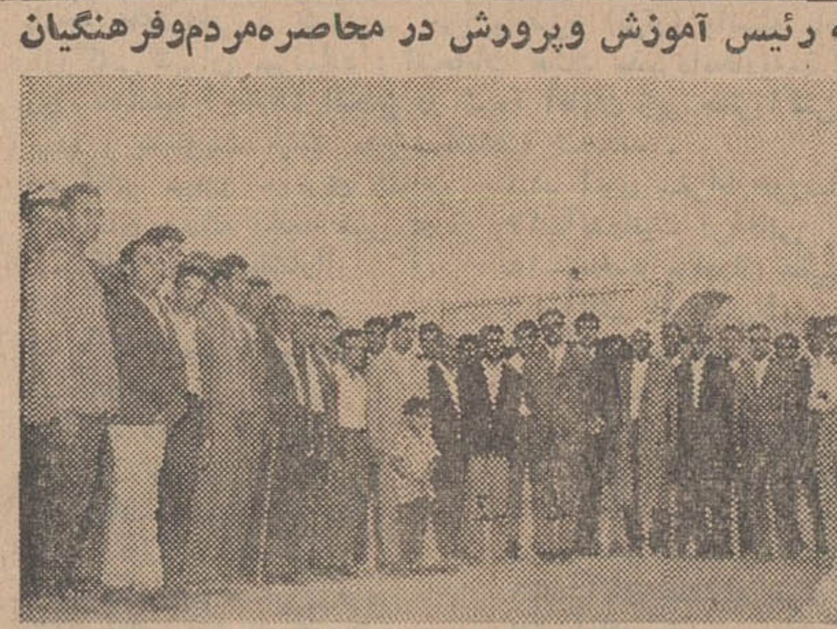
خانه رئیس آموزش و پرورش در محاصره مردم و فر هنگیان

۳۰ ساعت تفریح و سرگرمی با حداقل هزینه بایک نیک خانوادگی (مفرح) حرکت بعد از ظهر پنجشنبه هر هفته میدان ۲۴ اسفند اول امیرآباد شماره ۹ تلفن ۶۱۳۷۵۲