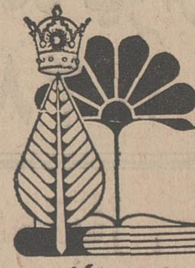
کتابخانه ملی و اسنادخانه ایران

ما امروز پس از شصت و سه سال در برابر آنهمه عظمت انسانی که از نیروی ایمان و در ستمکاری و شرافت تبری سرشده میگرفت سر تنظیم فرود می آوریم و در دوران آژامش و استقراری که اکنون کشور ما از آن برخوردار است امیدواریم که قلندرت اخلاقی و نیروی ایمان پدرانمان برای بسط عدالتو تحکیم مبانی مشروطیت الهام بخش ما باشد .