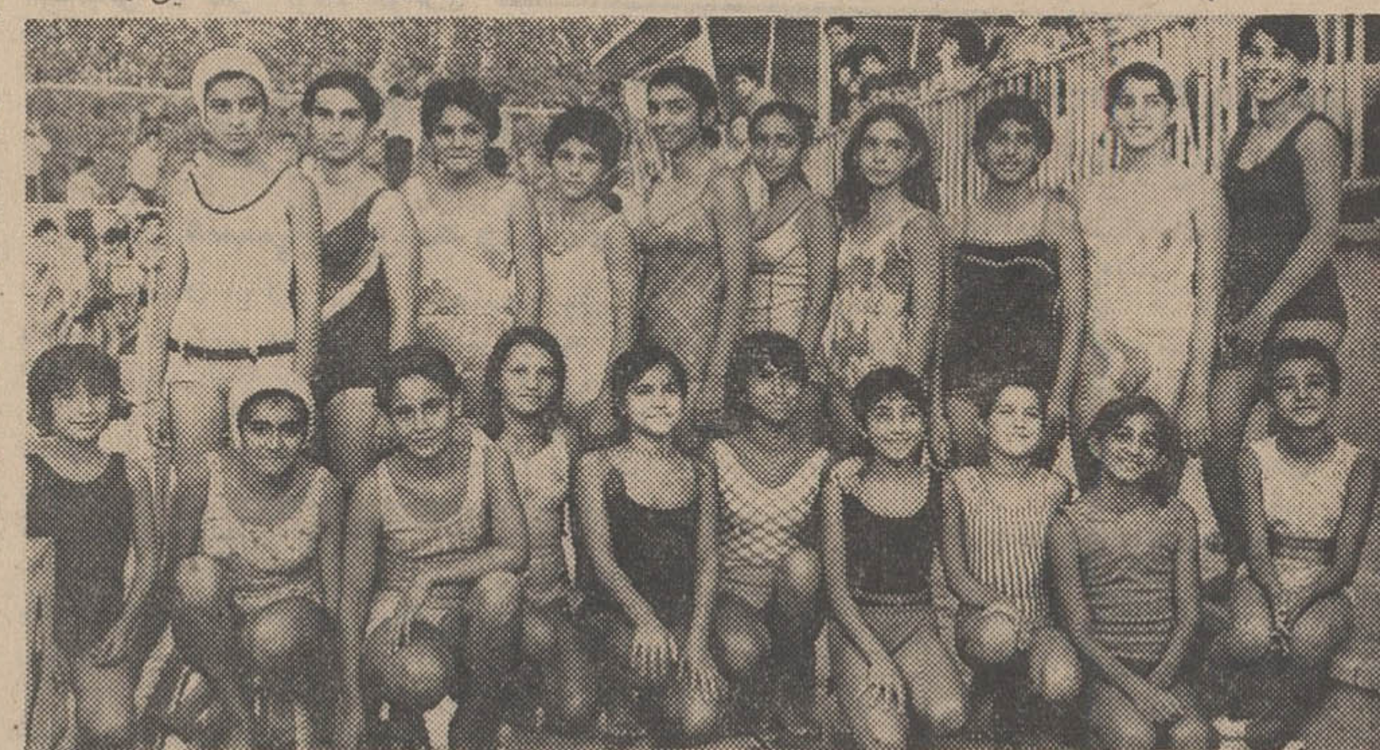
دختران شرکت کننده در مسابقات شنای کاپ اطلاعات