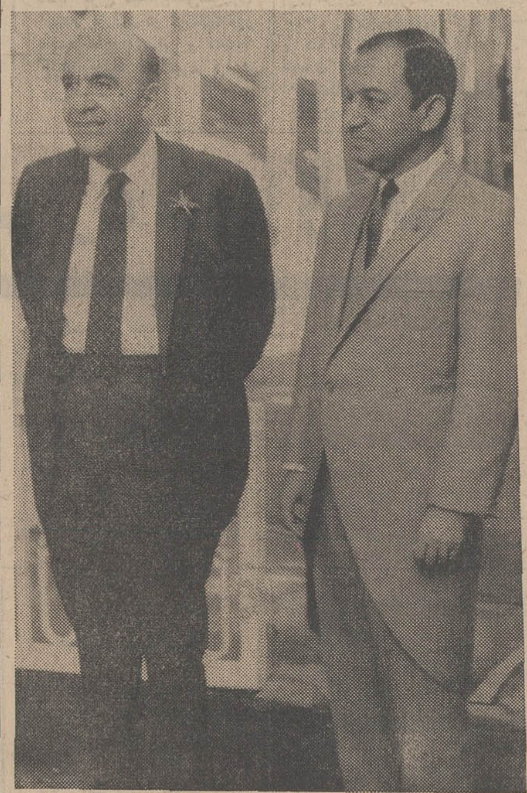
آقای امیرعباس هویدا نخست‌وزیر و هوشنگ انصاری قبل از مراسم معرفی بخش هواپوی