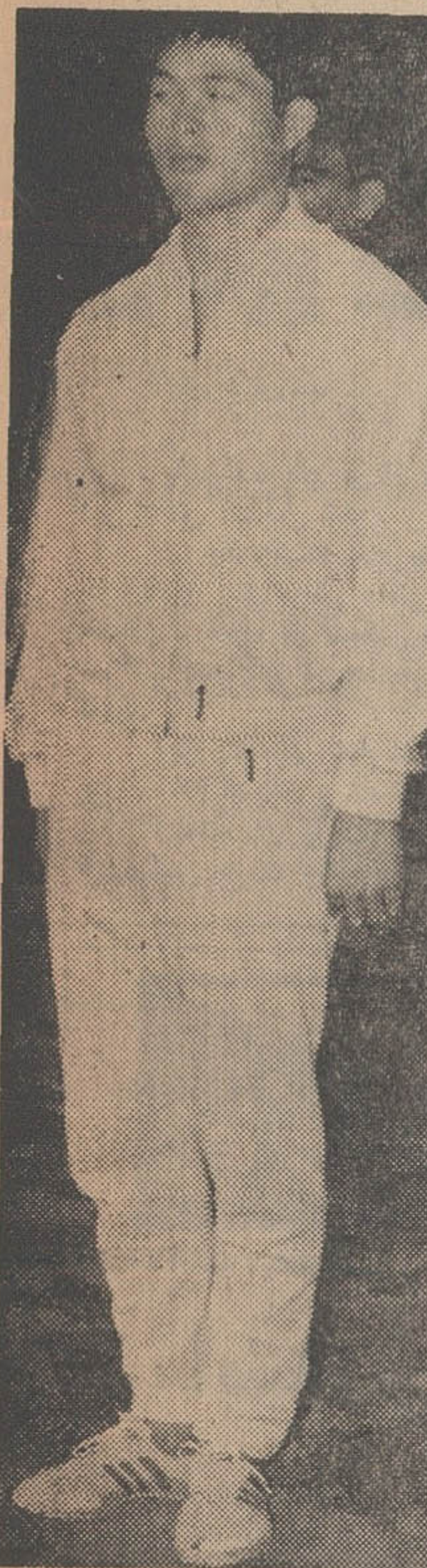
رئی هی تاک هافبک استثنائی تیم فوتبال ارتش کره