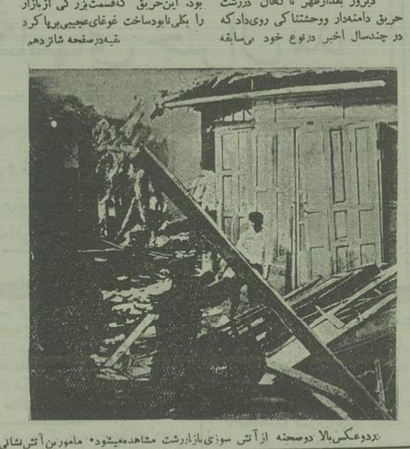
درد عکس بالا دو صحنه از آتش سوزی بازار شت در اطراف مغازه‌هایی که در بازار آتش گرفته مشغول اطفا میباشند...