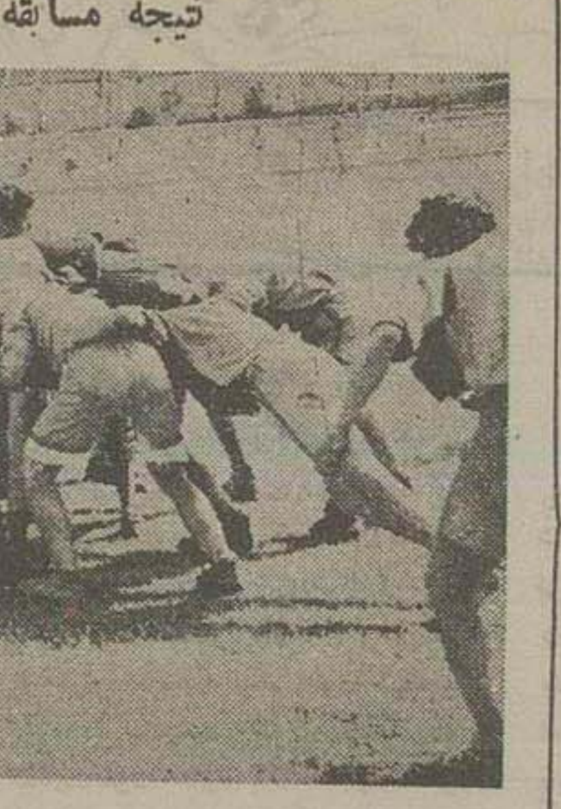
یک صحنه از مسابقه رگبی روز پنجشنبه