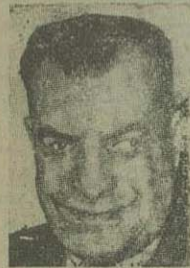
عقیقی پاشا رئیس دفتر دربار مصر

نحاس پاشا بعلت قصور در تأمین امنیت عمومی و استقرار نظم و آرامش برکنار گردید