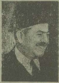
ماهر پاشا نخست وزیر جدید