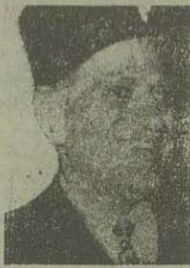
نحاس پاشا نخست وزیر معزول