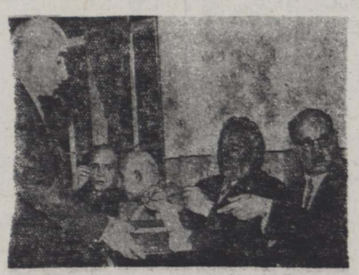
تعیین اعضای اصلی و علی‌البدل انجمن نظارت مرکزی