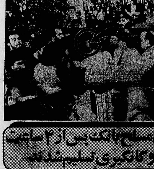
دزدان مسلح بانک پس از ۴ ساعت گروگانگیری تسلیم شدند

دوشنبه دوازدهم آبانماه ۱۳۵۹ - شماره ۱۶۲۷ - تک شماره ۱۵ - ریسال