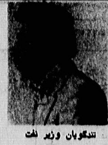
دانشجویان وزیر ملت