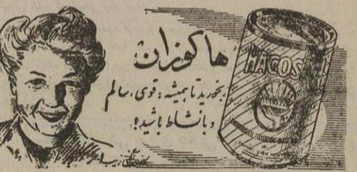
ماگوسان... بابت شایسته!

برای انبار تجاری - کارخانه - نگاه مناسب است شامل ۴۵۰ متر سائیل شبروانی ۶۰۰ متر انبار های دیگر و محوطه دوشین واقع در نزدیکی بل راه آهن بدون سر قفل اجاره داده میشود - خیابان بوزدرجهری - سرای سعادت تجارخانه پیروزتلفن ۲۰۶۵۰ مراجعه شود. ۱۸۰۴۹-آ ۳-۳