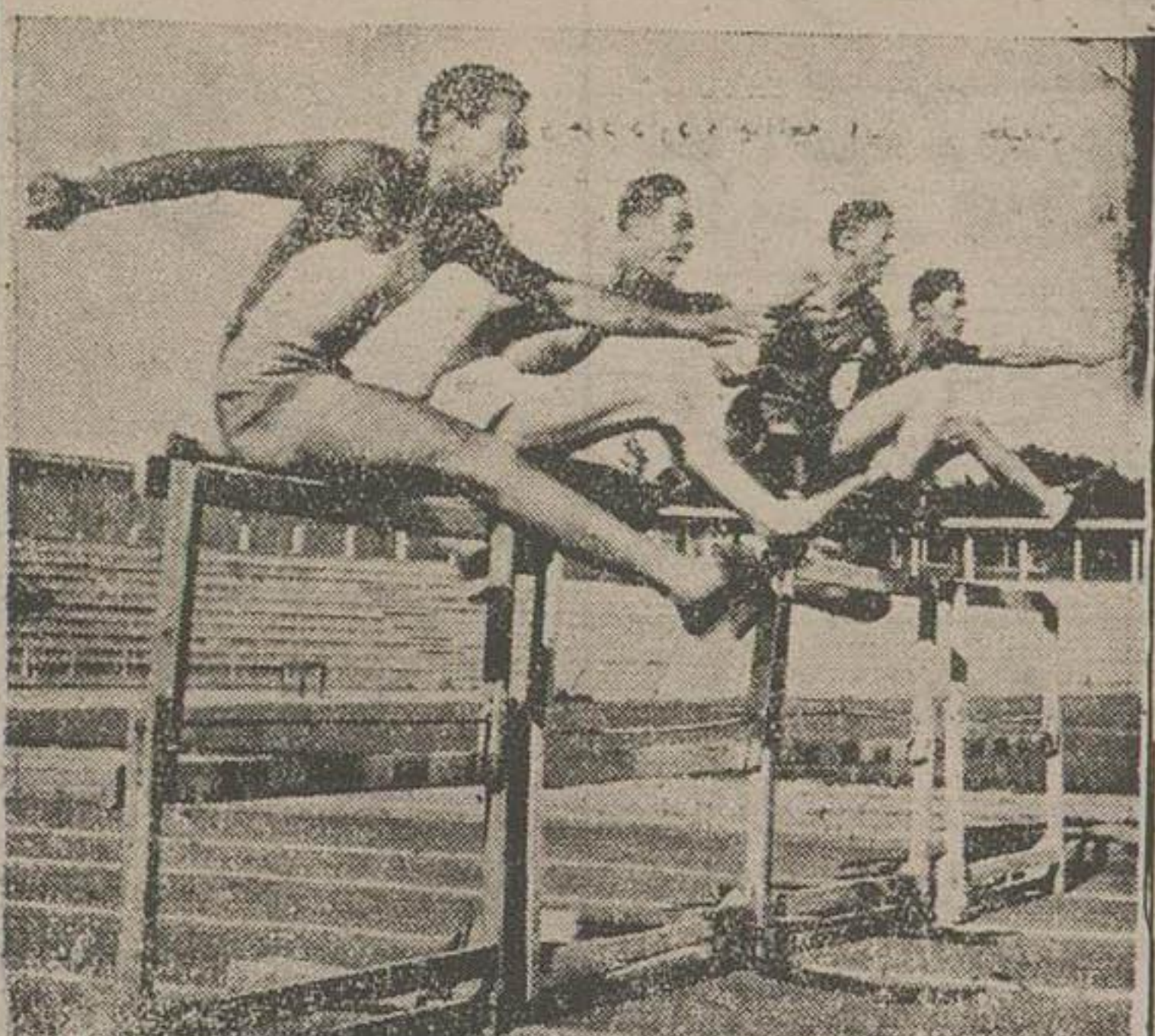
روزهای جمعه ۱۲ و ۱۳ خرداد مسابقات قهرمانی دو میدانی باشگاهها انجام شد.