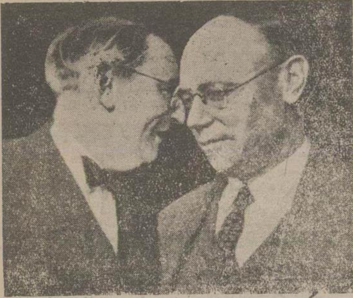
سناتور تفت مخالف برنامه کمک نظامی امریکا و سناتور واندربرگ و اندرک در جلسه تاریخی دیروز صحتی بطور خصوصی گفتگو کردند.

مستر اچسن وزیر امور خارجه امریکا در کمیته مشترک روابط خارجی و نیروهای مسلح امریکا گفت: صلح دنیای آزاد، بستگی به امنیت ایران دارد