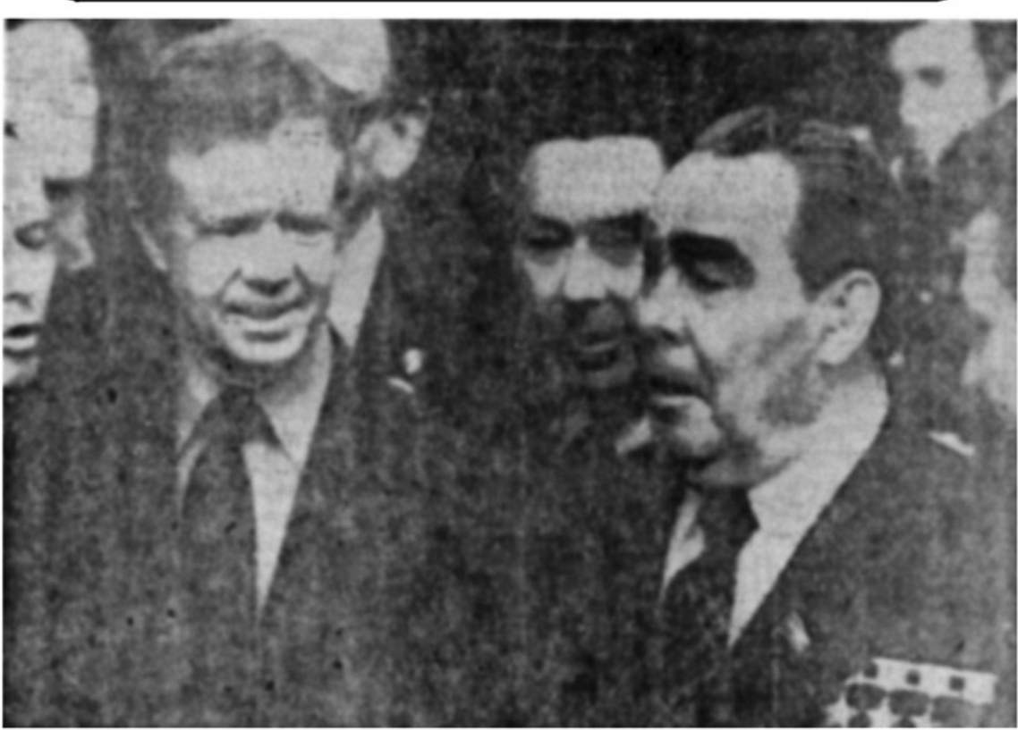
این عکس از اولین دیدار رهبران آمریکا و شوروی در قصر «وخیترک» وین برداشته شده است. برژنف رهبر شوروی در اولیو دو مین دور مذاکرات خود مسائل مربوط به سال ۱۳۵۸ (دومین قرارداد تجدید سلاحهای استراتژیک) و نیز مسایل مربوط به اوضاع جهان و روابط شرق و غرب مذاکرات امیدوار کننده ای انجام داده اند.