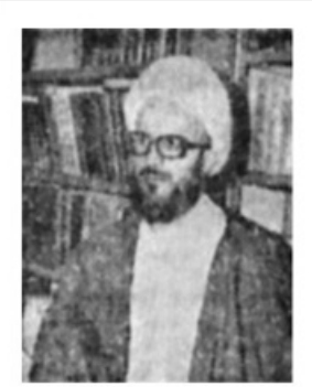
آیت‌الله مکارم شیرازی