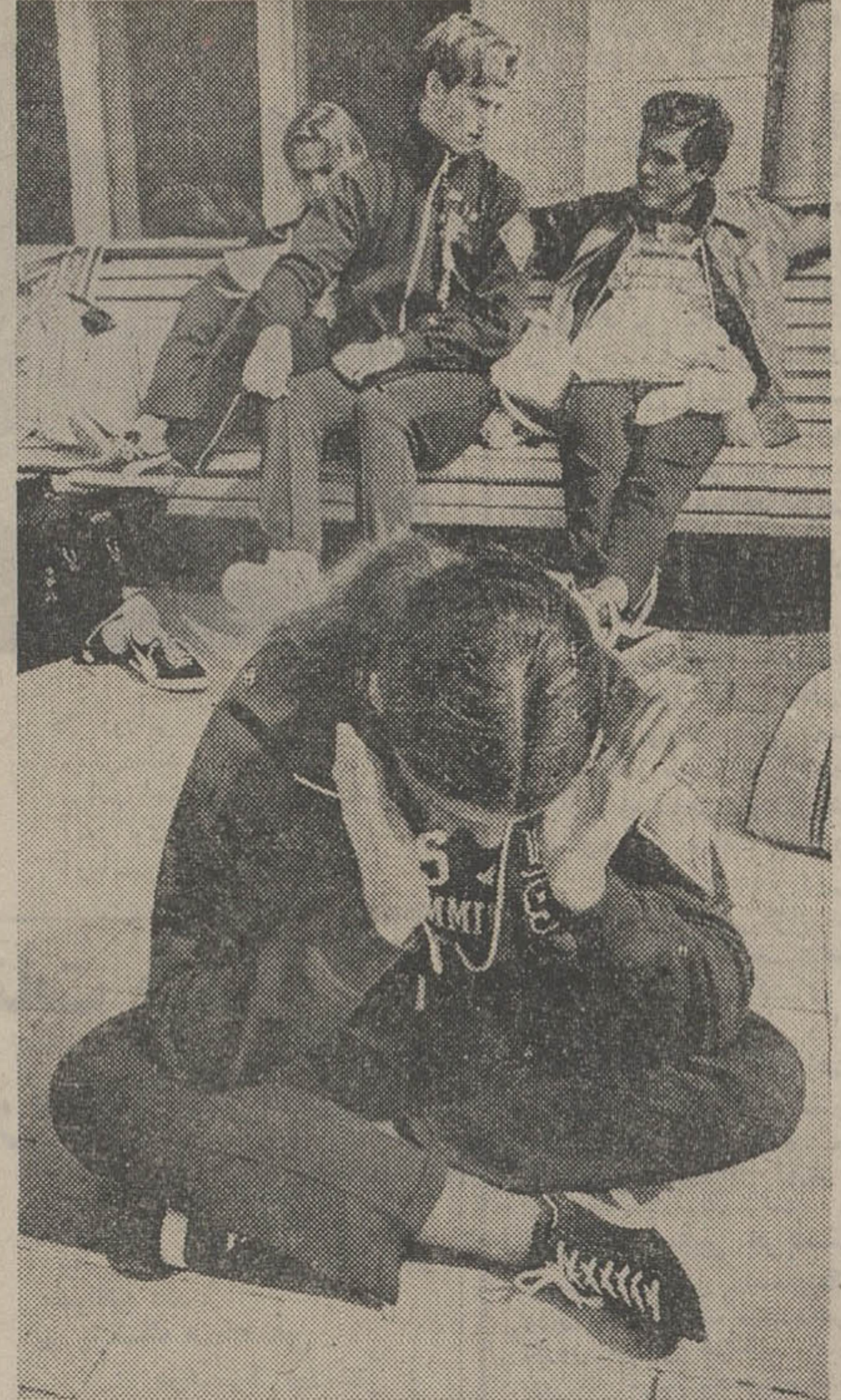
«کار» شناگر آمریکایی و برنده ۴ مدال طلا در مسابقات جهانی بازی‌های المپیک دانشجویان، ایستادند و این چنین خود را برای مسابقه آماده می‌کردند.

این ورزشگاه که گنجایش نزدیک به ۷۱ هزار تماشاگر داشته را خواهد داشت با هزینه‌ای معادل ۱۲۰۰ میلیون ریال ساخته شده است و سومین استادیومی است که تاکنون برای دیدارهای جام جهانی تحویل گرفته شده است. پس از پایان مسابقات استادیوم مزبور محلی برای تمرین ورزشکاران شهر و نیز تیم‌های محلی «درخواست» در اختیار خواهد شد. قبل از استادیوم «گلزنرگرن»