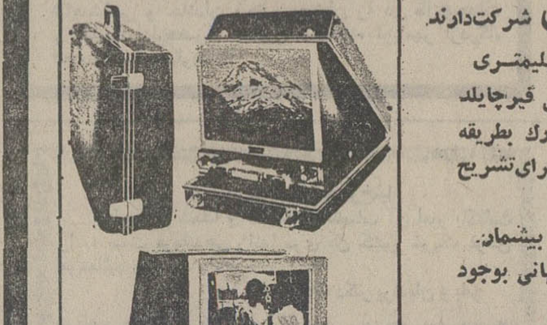
مژدهای بزرگ سازمانهای آموزشی - صاحبان صنایع و کالوموساتیکه

در نمایشگاه بین المللی ایران شرکت داورند فعالیت های خود را در هر زمینه ای بقیلم ۸ میلیمتری رنگی دوازده و با پروژکتور تلوزیونی و کاستی فیرچیلد آمریکا روی صفحه پروژکتور و یاروی برده بزرگ بطریقه لوپ ولاینقطع نمایش بگذارند. در مواقع لزوم برای تشریح تصویر ا ثابت نگهدارند.