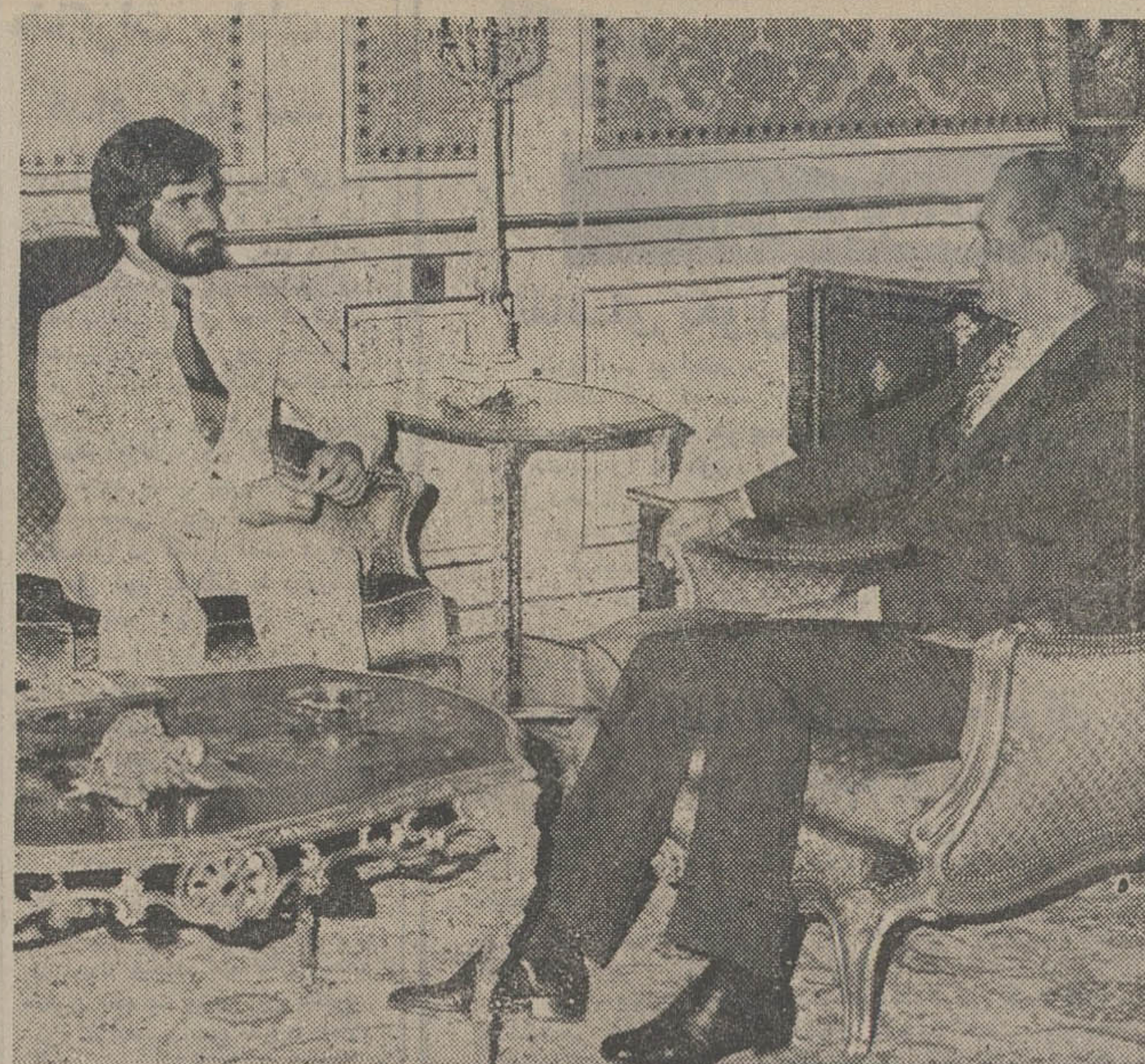
شاهنشاه آریامهر بعد از ظهر دیروز، شیخ محمد بن راشد آل مکتوم وزیر دفاع امارات متحده عربی را بحضور پذیرفتند. در این شرفیایی شیخ حسین مکتوم بن جمعه سفیر امارات متحده عربی نیز افتخار حضور داشت. عکس وزیر دفاع امارات متحده عربی را در حضور ملوکانه نشان میدهد