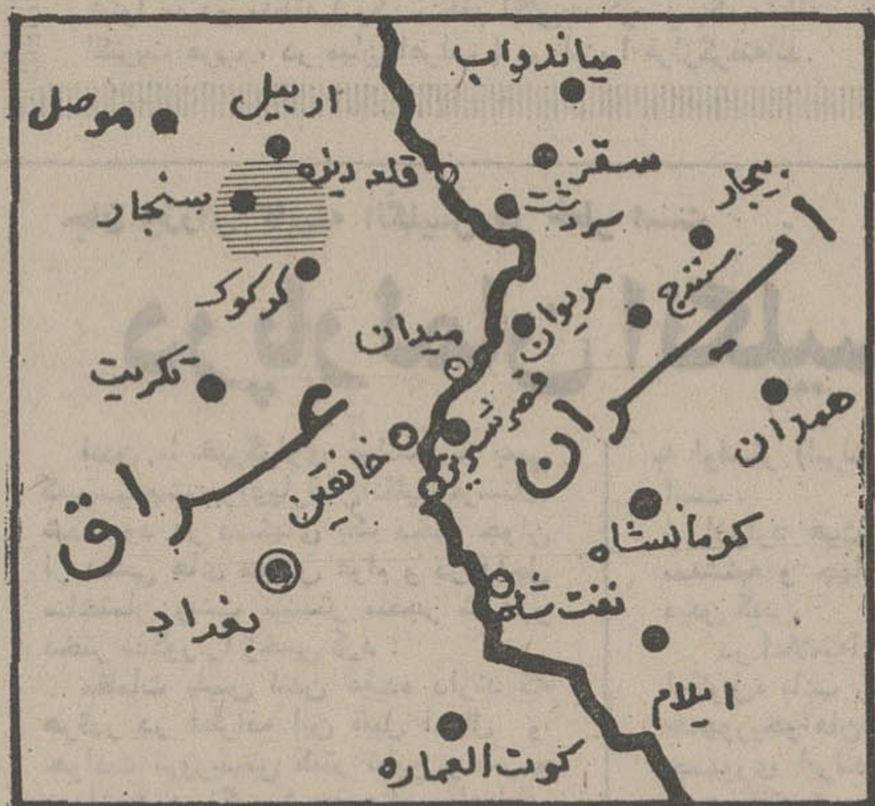
در این نقشه «سنچار» محلزده و خورد اکراد با نیروی ارتش عراق با علامت «هاشور» مشخص شده است.