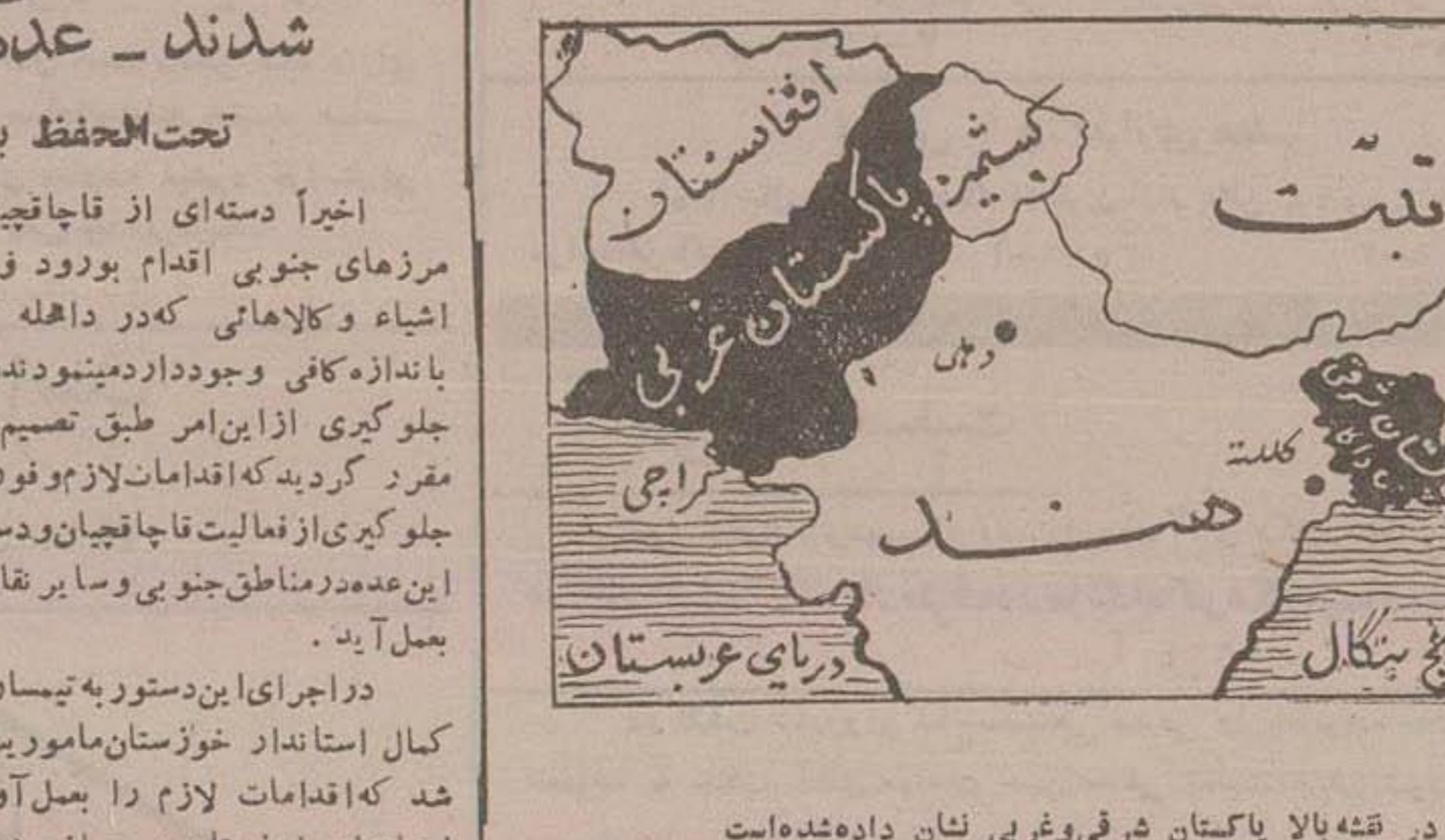
در نقشه بالا پاکستان شرقی و غربی نشان داده شده است

محمد علی رهبر جبهه متحد پاکستان شرقی را بخیانیت متهم ساخت