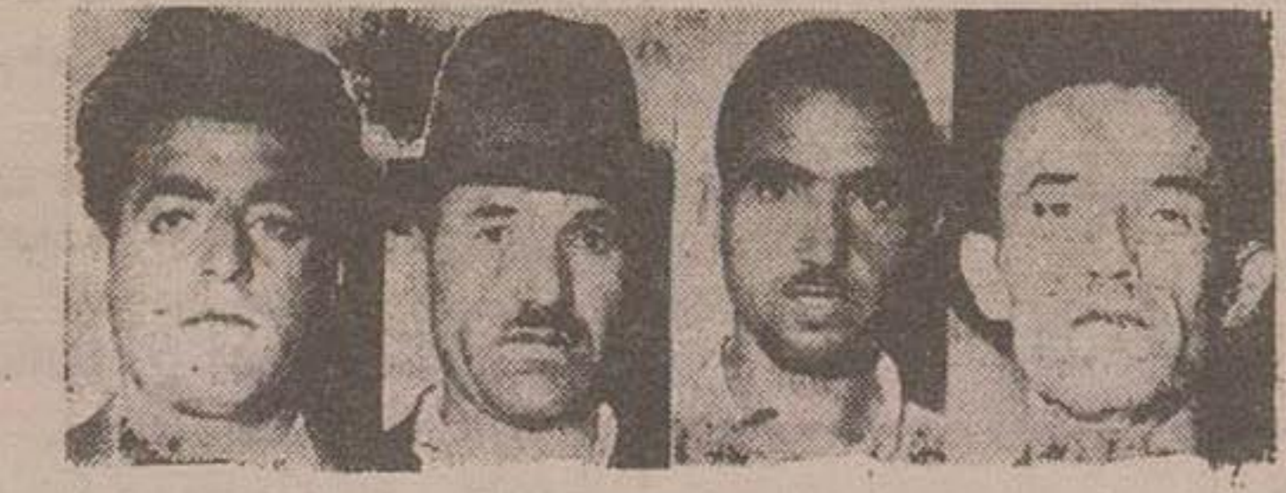
سیاح، صفا، خالنه، کبیری

اخیراً دسته ای از قاجاقچیان در مرزهای جنوبی اقدام بودند و فروش اشیاء و کالاهائی که در داهله کشور با اندازه کافی وجود دارد مینمودند و برای جلوگیری از این امر طبق تصمیم دولت مقرر گردید که اقدامات لازم فوری برای جلوگیری از فعالیت قاجاقچیان و دستگیری این عده در مناطق جنوبی و سایر نقاط کشور بعمل آید.