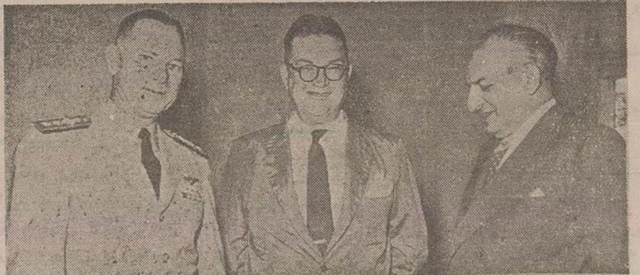
دریاسالار دادلی، سفیر آمریکا و معاون وزارت خارجه در ضیافت منزل سفیر آمریکا

جمعه ۲۴ شهریورماه ۳۴ در زمین امجدیه لنی فوتبال اصفهان با قهرمان فوتبال تهران تیم نادر باشگاه شمع بهاء بلیط ۱-۰-۳۰-۳۰ ریال است آ-۱۱۶۸۷