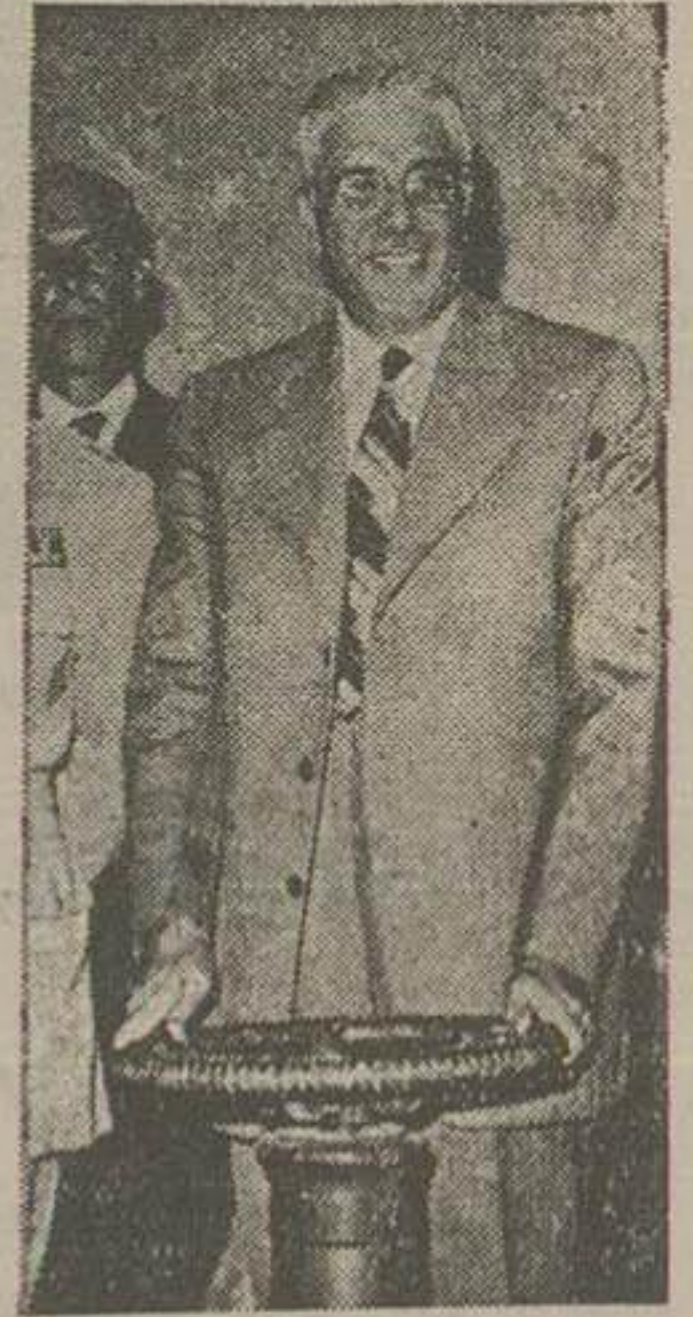
استاندار تبریز منبع آب آبراه باز کرد

باید اضافه کرد که در اول کار نوبت مبلغ سه هزار ریال بتوان حق انشعاب یا حق امتیاز وصول میکنند.