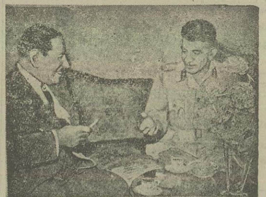
هلی ماهر نخست وزیر سابق مصر اولین شخصی بود که بهجانشین خود ژنرال نجیب تبریک گفت

دیشب وارد خرمشهر شد کشتی تروزی «بزان» حامل سی و هفت دستگاه واگون مسافربری راه آهن ایران طبق خبری که روز پنجشنبه منتشر کردیم قرار بود ساعت ۹ صبح روز جمعه (دیروز) با سکه بند خرمشهر پهلو گیرد. ولی بعلمت مساعدن بدون اوضاع جوی و عمل دیگر، کشتی مزبور در ساعت دهم شب گذشته وارد آبهای ساحلی بند خرمشهر شد و پس از پانزده دقیقه در صفحه هفتم