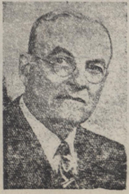
دالی وزیر امور خارجه امریکا

واشنگتن - جان فاستر دالی وزیر خارجه امریکا پریش بنطق مهمی در باره مسافرت اخیر خود بکشورهای خاور میا و آسیای جنوبی ایراد کرد که بوسیله رادیو تلویزیون در سراسر امریکا پخش گردید. دالی در نطق خود گفت آنچه امریکا بکشورهای خاور میا و آسیای جنوبی در موقع بسیار مقتضی عمل آمده است. وی شرح مسافرت خود را باینکه از کشورهای خاور میا و آسیای جنوبی جدا گانه بیان نمود در ماه این مسافرت استاسن رئیس برنامه امنیت مشترک نیز همراه وزیر خارجه امریکا بوده است دالی درباره ایران چنین گفت: بقیه در صفحه هفتم