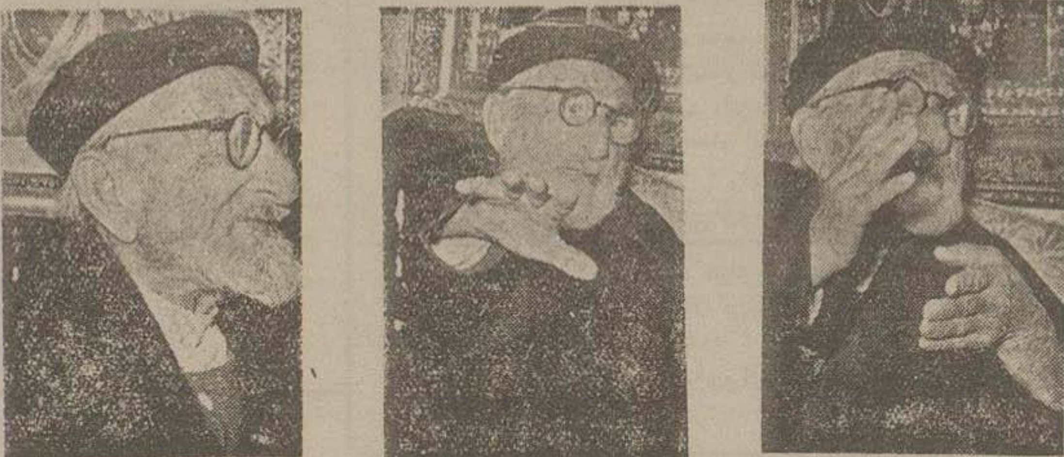
الحمد لله که قانون پرسم مجازات شدند خداوند منتقم است و مکافات میدهد همینکه صدای کربیه را شنیدم داستم...

سه عکس و سه جواب از پدر مرحوم سپهبد رزم آراء در سه حالت مختلف