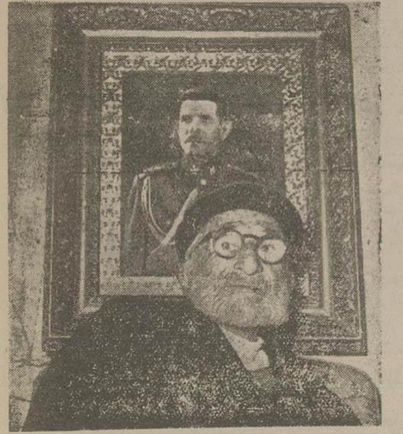
این عکس امروز از پدر ۱۰۸ ساله سپهبد رزم آرا گرفته شده است تصویر مرحوم رزم آرا پشت سر او دیده میشود

در جلسه دیشب دولت در اطراف تعدیل بودجه مذاکراتی بعمل آمد و فرماندار کل بلوچستان تقدیر شد ساعت ه بعد از ظهر دیروز جلسه هیئت دولت برپاست آقای علاء نخست وزیر در کاخ نخست وزیری تشکیل شد و با محوریت چاری کشور رسیدگی بعمل آمد. در این جلسه در اطراف تعدیل بودجه کشور مذاکراتی صورت گرفت و راههای مفیدی انتخاب شد. شمساً درباره امنیت کشور نیز تصمیماتی اتخاذ گردید. در جلسه دیشب هیئت دولت نامه آقای مهران فرماندار کل بلوچستان نیز قرائت شد و چون ایشان آقای علم وزیر کشور اطلاع داده بودند که از یکصد هزار ریال هزینه ماهیانه فرمانداری کل پنججاه هزار ریال صرفه جویی کرده اند این اقدام مفید آقای مهران مورد تقدیر قرار گرفت. دورستوران ارزان قیمت دیگر دایر میشود چون هجوم اهالی برای استفاده از غذاهای رستورانهای ارزان قیمت جمعیت خیره تریا پهلوی در این روزها فوق العاده زیاد شده است تصمیم گرفته شد که دو رستوران دیگر علاوه بر سه رستوران فعلی در نواحی جنوبی تهران دایر گردد - در هریک از این رستورانها روزانه برای یک هزار نفر غذای ارزان طبخ و فروخته میشود.