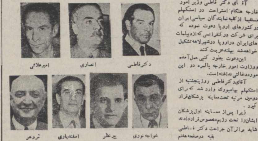
آقای دکتر فاطمی وزیر امور خارجه هنگام استراحت در استکهلم مستقیا از کلبه نمایندگان سیاسی ایران در کشورهای اروپا دعوت نموده که برای شرکت در کنفرانسی که از بیلیات های ایران در اروپا در شهر لاهه تشکیل خواهد شد بپهنه عزیمت کنند این دعوت بطور کتبی حمل آمده و وزارت امور خارجه بالمره در این مورد خاتمی نداشته است آقای دکتر فاطمی روز پنجشنبه از استکهلم به ماموریت وارد شد که برای دومین مرتبه تحت مابنه پزشکان قرار گیرد زیرا پس از معاینه اول پزشکان ایشان را تحت رژیم مخصوص قراردادند شاید بر اثر آن جرات دکتر فاطمی بقیه در صحنه هفتم

تا چند روز دیگر بریاست وزیر خارجه در لاهه تشکیل می شود این کنفرانس بیش از دو روز طول نخواهد کشید - احتمال دارد دکتر فاطمی تا ده روز دیگر بایران مراجعت کند - سفیر کبیر ایران در فرانسه فردا بیاریس عزیمت میکند