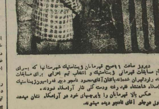
دیروز ساعت ۹ صبح قهرمانان زمینستیک شهرستانها که برای انجام مسابقات قهرمانی زمینستیک و انتخاب تیم اهلی برای مسابقات فیلان در تهران آمده‌اند با آقای محمود نامی دبیر فدراسیون زمینستیک پارسا شاهنشاهی قدر رفته و دست کلی ثار آرامگاه نمودند.