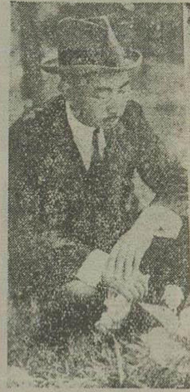
امپراتور ژاپن بکل کاری و سیاستمدار علاقه مفرطی دارد

نقشه وسیعی برای رقابت اقتصادی با دولت‌های بزرگ طرح کرده است یک وجب خاک و یکصد میلیون نفر جمعیت!