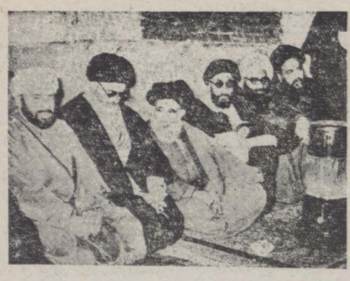
حضرات آیات الله بیهبانی، امام جمعه تهران و چند تن از علماء در مجلس ترحیم امروز مسجد شاه

گزارش تلفنی خبرنگار ما از قم حاکیست که بناسبت رحلت حضرت آیه الله صدر از یادگار امروز بازار و کلیه دکا کین شهر قم تعطیل بود و آقایان علماء اعلام و روحانیون و طلاب علوم دینی و بازرگانان و عموم طبقات در مجلس ترحیم بزرگی که از طرف حضرت آیت الله بروجردی مرجع تقلید مسلمین جهان دیروز بعد از ظهر و امروز قبل از ظهر در مسجد بالا سر منقذ گردیده بود شرکت داشتند و نمایندگان اعلی حضرت همایون شاهنشاهی و آقای نصرت وزیر نیز در مجلس ترحیم موزر شرکت کردند