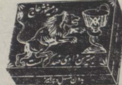
در میفرودگاه در جمیع های زیای پلاستیکی ۱۲۸۳۹-آ