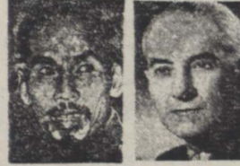
ژنرال ناوار هوشی مینه

دیروز منابع نظامی فرانسه از هندوچین اعلام داشتند که قوای فرانسه در برابر حمله ای که از طرف نیروهای ویتنامی بطرف جنوب غربی لانوس آغاز شده سخت مقاومت میکنند طبق آخرین گزارشهای واصله اکنون جنگ های شدید و خونینی بین کمونیستها و نیروی فرانسوی در جریان است. حمله جدیدی که از طرف نیروهای ویتنامی علیه لانوس در هندوچین آغاز شده موجب نگرانی محافل سیام را فراهم آورده است و انتظار میرود که دولت سیام در این باره سازمان ملل متحد شکایت کند.