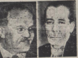
آراسه مولوتوف سفیر کبیر ایران وزیر امور خارجه شوروی

باسخ دولت ایران به پیام آقای مولوتوف وزیر خارجه شوروی امروز برای آقای نادر آراسه سفیر کبیر ایران در مسکو فرستاده شد تا توسط سفیر کبیر ایران در شوروی تسلیم شود