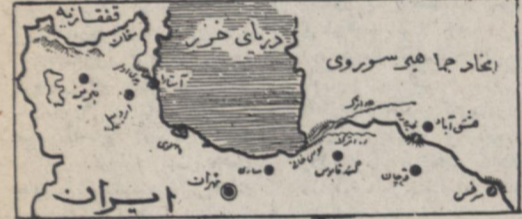
شش نقطه مزی واقع در شمال ایران که مورد اختلاف بین دولتین ایران و شوروی میباشد در روی نقشه مشخص شده است