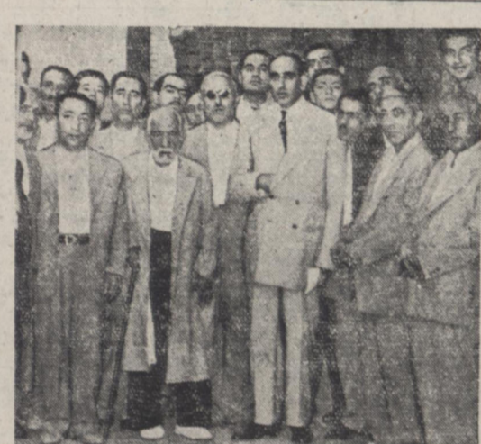
نمایندگان جامعه بازرگانان اصناف و پیشه وران عصر روز پنجشنبه با آقای دکتر معظمی در مجلس ملاقات نموده و انتخاب ایشان را بسمت ریاست مجلس تبریک گفتند - این عکس عده ای از آقایان بازرگانان را با رئیس جدید مجلس نشان میدهد

روز چهارشنبه هفته گذشته که در انتخاب رئیس مجلس عمل آمد بیشتر وقت آقای دکتر معظمی در چند روز اخیر صرف ملاقات و پذیرایی از طبقات مختلف و دستجاتی شده است که برای تبریک مقام ریاست در مجلس حضور یافته اند. با اینکه قبل از ظهر روز پنجشنبه عده ای از نمایندگان اصناف و تجار بازاری را در مجلس در اطاق هیئت رئیسه ملاقات نموده و احوال مقام ریاست بقیه در صفحه چهارم