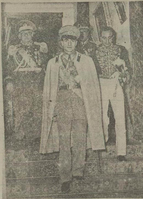
اعلیحضرت مهابونی پسر ازبایان سلام دیروز، هنگام خروج از کاخ گلستان

مراسم سلام عید سید عبدالعزیز دیروز صبح در پیشگاه شاهنشاه در کاخ گلستان انجام شد. این مراسم از ساعت هشت و نیم آغاز گردید و نخست هیئت وزیران شرفیاب شدند. آقای کاظمی نایب نخست وزیر و وزیر دارایی نیز بکات این عید بزرگ اسلامی را از طرف هیئت دولت بحضور ملوکانه تقسیم نمود و معروض داشت: