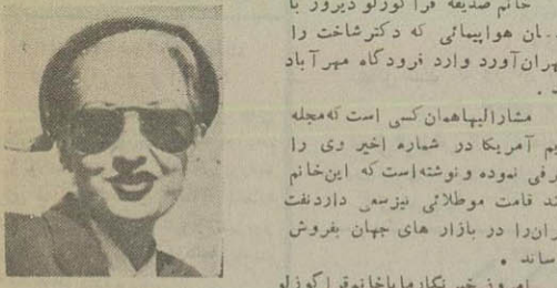
ملاقات کرد و مشارالیها گفت: هنوز معلوم نیست تا چه مدت در ایران خواهیم ماند و با چه کسانی ملاقات خواهیم نمود.

نخستین زنی که برای خرید نفت دیروز با هواپیما حامل دکتر شاخت وارد تهران گردید