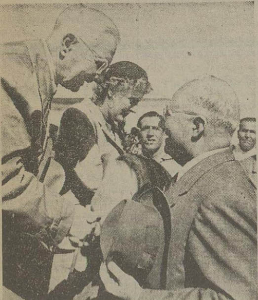
همینکه دکتر شاخت با آقای همسرش از هواپیما خارج شد آقای کاظمی وزیر دارایی دست او را فشرد و خیر مقدم گفت:

و در ساعت بهی بملاقات نخست وزیر رفت خانم وی که همراه اوست دیروز در شهر گردش نمود