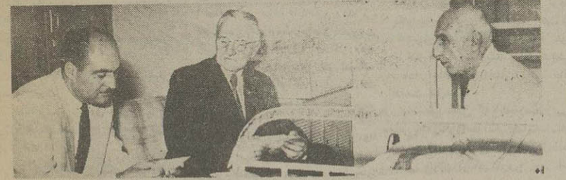
دکتر شاخت با آقای مهندس طالقانی وزیر کشاورزی آقای نخست وزیر ملاقات نمود.

دو روز در فرودگاه از ساعت دویمه از ظهر دو نفر از وزرای یعنی آقایان کاظمی وزیر دارایی و طالقانی وزیر کشاورزی در مهر آباد حضور یافتند تا از دکتر شاخت و همسرش که بنا بدعوت دولت ایران بتهران می آمدند استقبال کنند. آقای کاظمی بعنوان نماینده دولت و آقای مهندس طالقانی بعنوان میزبان بنا بود از شاخت استقبال نمایند ساعت یقیه در صفحه چهارم