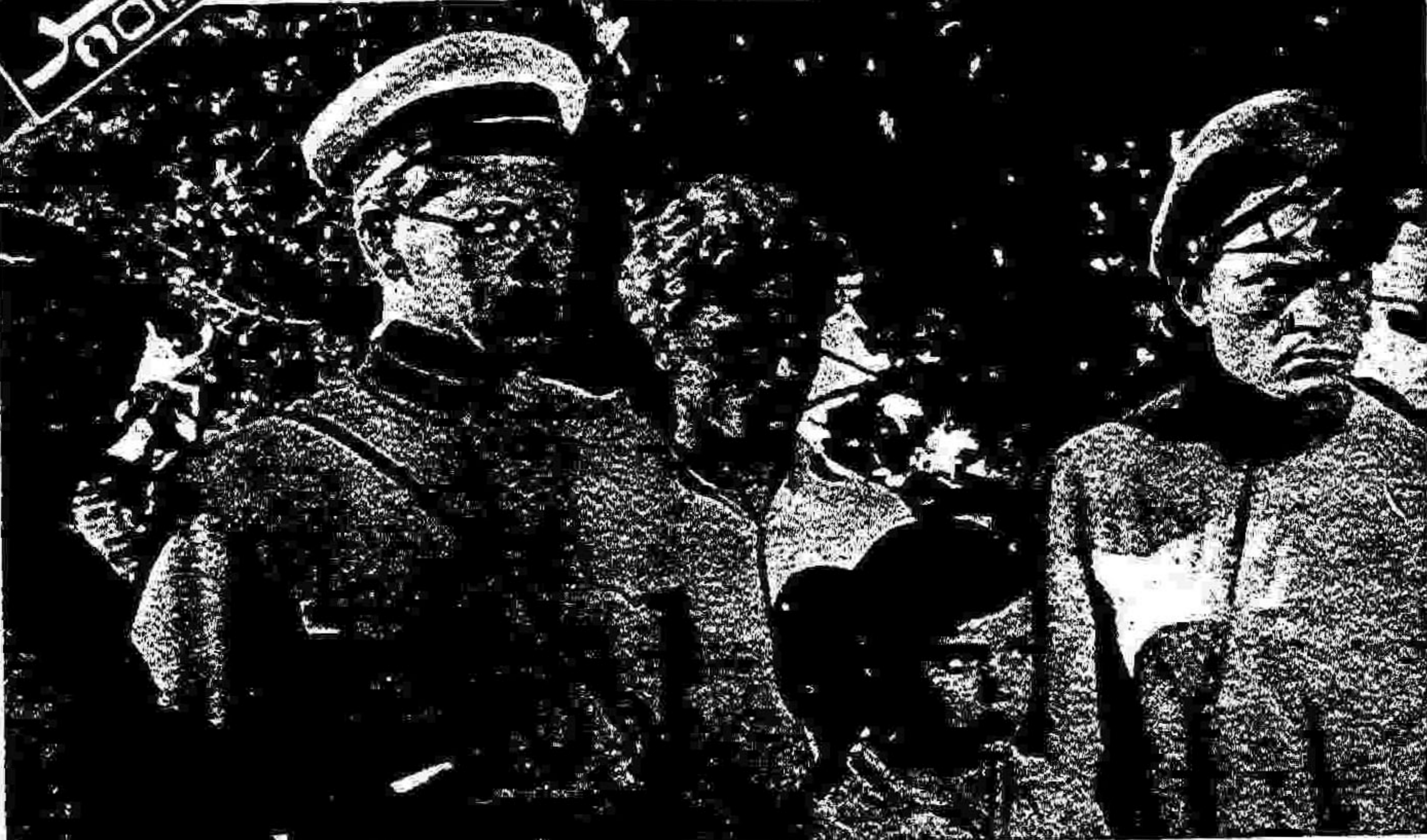
صحنه‌ای از فیلم: ماکارنکو و انسان‌هایی که اومیساخت