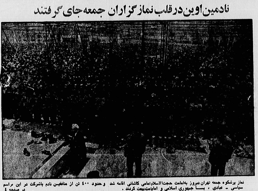
نماز پرشکوه جمعه تهران در روز به امامت حجت الاسلام امامی گاشانی اقامه شد و حدود ۵۰۰ تن از منافقین نام با شرکت در این مراسم سیاسی - عبادی ، بسا جمهوری اسلامی و امامت بیعت کردند . در صفحه ۴

آیت الله مشکینی در مراسم نماز جمعه قم : دولت موظف است ثروتهای نامشروع را به صاحبان اصلی برگرداند در صفحه ۵