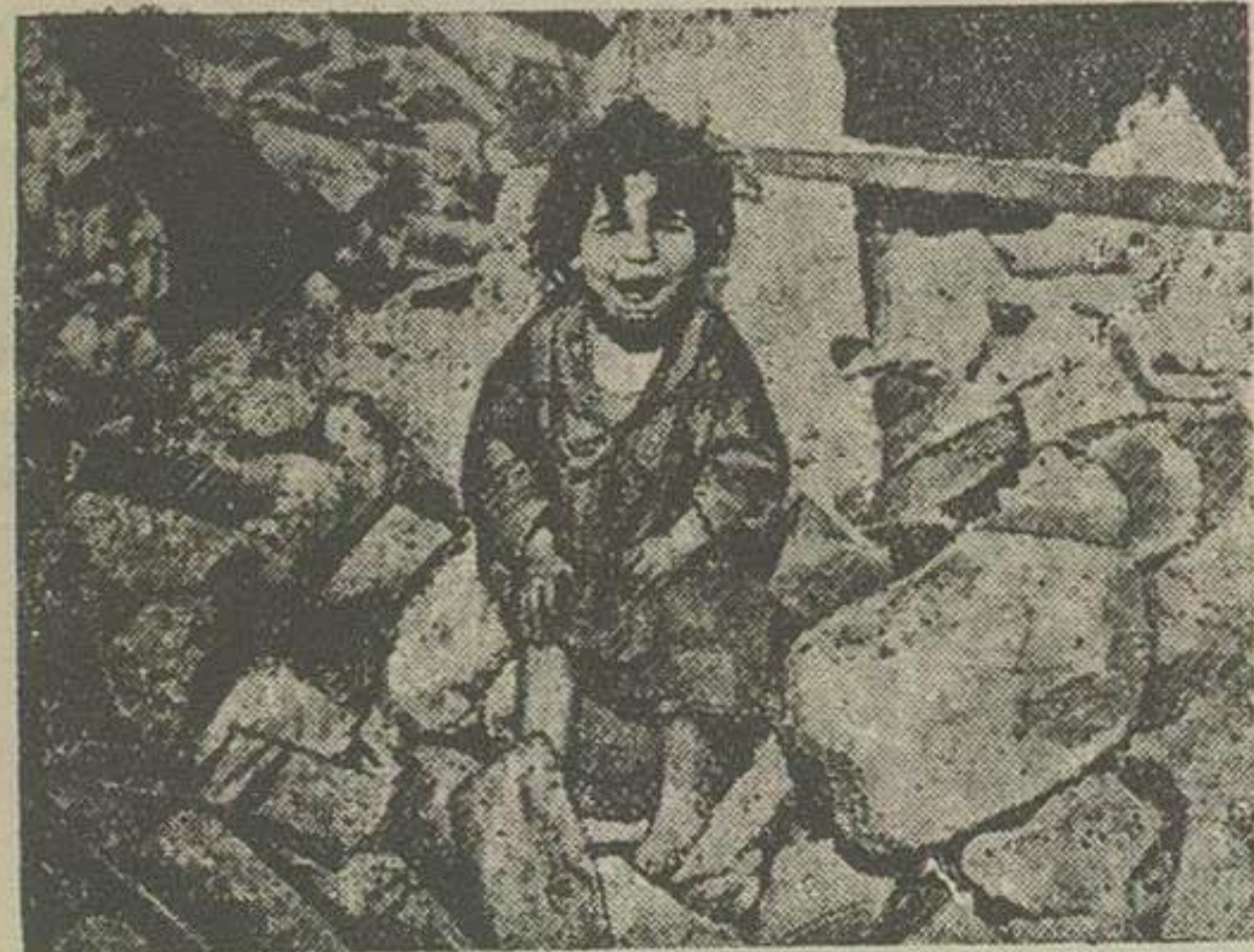
تنهادرمان و براته های شهردار لئان و ویل کودکی که بدرومادر خود را از دست داده گریه میکند

اورلئان و ویل- خبر گزار فرانسه در ساعت ۳ بعد از نیمه شب دیروز مجددا در اورلئان و ویل زلزله آمد زمین لرزه اول تا اندازه ای شدید بود و باقیمانده دیوارها خراب کرد با ادامه زلزله روحیه مردم اورلئان و ویل که در خارج از شهر بسمیرا ندیدند ضعیف شده که ساکنین اروپائی این شهر تصمیم گرفته اند یکی کوچ کرده و اغلب آنها بفرانسه باز گردند