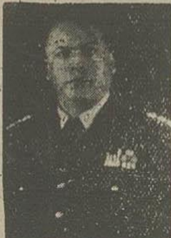
سرهنگ سپه پور

کشف توطئه و قطع نفوذ کمونیسم در ارتش ایران برای دنیای آزاد موفقیت درخشانی محسوب میشود