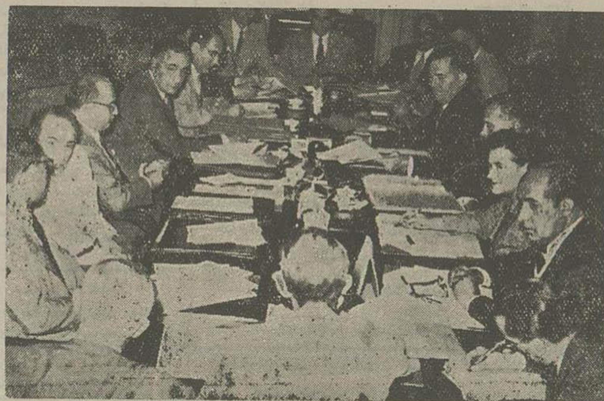
جلسه ای که صبح امروز با شرکت چند تن از آقایان وزیران و مدیر عامل سازمان برنامه و مدیران صندوق مشترک ایران و امریکا در کاخ ایض تشکیل شده بود

بطوریکه یکی از آقایان عضو کمیسیون اظهار میکرد بدین جهت در اطراف امور بهداشتی و فرهنگی و کشاورزی