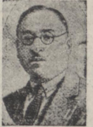
سویدی بشاد

هیش توفیق السویدی وزیر خارجه عراق طی نطق مفصلی که در جلسه پارلمان آن کشور ایراد کرده سیاست دولت عراق را نسبت به کشورهای همسایه عراق روشن نموده است.