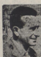
نماینده کمیته ایتالیائی سویر در تهران

در ۲۰-۲۱ امروژ تأیید نمود که سه فنکس میرال و «آلبا» و «برزا» درماه گذشته محصولات کوفافو خود را در بازارهای کمیته سویر در بندر نیز تخلیه نمودند مجدداً بطرف آبهای ایران حرکت کرده و در اوایل مادون در بندر آبادان و مشورلنگر خواهند انباشت