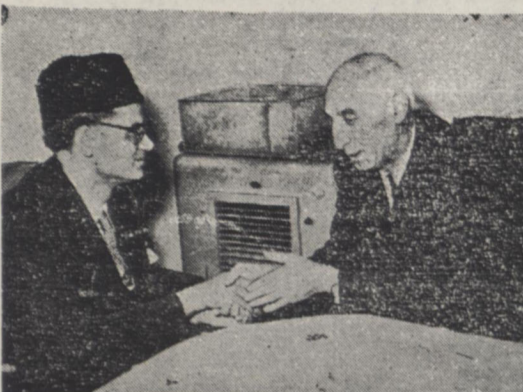
آقای نسیم حسین کاردار سفارت پاکستان در ملاقات امروز با آقای نخست وزیر

سرتیپ مزینی افشار قاسم و احمد بلوچ را امروز برای انجام باز پرس باطاق باز پرس نظامی آوردند