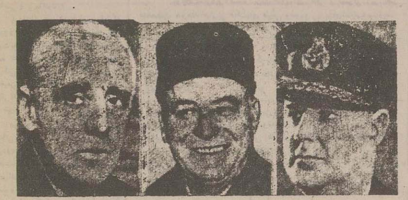
داریاس در جیمز فرمانده دریایی، ژرژ ل ژوتن فرمانده زمینی، مارشال ساندرز فرمانده هوایی