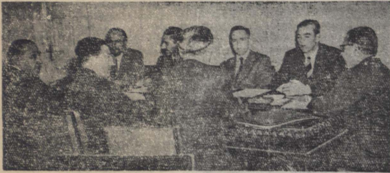
عکس بالا از دومین جلسه مذاکرات آقای هور با هیئت مشاورین نفتی آقای نخست وزیر که در روز سه در وزارت امور خارجه تشکیل شده است. آقایان وزیر امور خارجه و مدیر عامل سازمان برنامه نیز در این عکس دیده میشوند

کمیسیون مشاوره نفت با شرکت «هور» در وزارت امور خارجه تشکیل گردید - مذاکرات در پیرامون مسئله نفت به مرحله تجزیه و تحلیل این مسئله رسیده است «هور» تا یک هفته دیگر در تهران توقف خواهد کرد