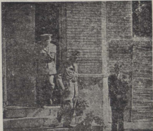
تیسارسپید زاهدی نخست وزیر هنگام خروج از مارت منزل آقای مشار که امروز در آنجا با آقایان نمایندگان غیرمستفی ملاقات و مذاکره کردند.

امروز نخست وزیر در منزل آقای مشار با آقایان نمایندگان غیرمستفی ملاقات و مذاکره کرد.