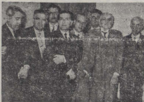
چندین از اعضای هیئت روزنامه نگاران ترک آقای سفیر کبیر ترکیه در ضیافت منزل آقای منصور سفیر کبیر ایران در ترکیه دیده میشوند

امروز شهردار تهران با افتخار روزنامه نگاران ترک ضیافتی میدهد - هیئت روزنامه نگاران از اداره تسلیحات ارتش بازدید کردند