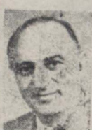
بنام اعلیحضرت همایونی آقای یسار الله عدلی بریاست کل تشریفات دربار شاهنشاهی منصوب گردید. آقای عدلی چندین مرتبه سفیر کبیر ایران و رهنمونان تعیین شده بود.

یکی از اعضای عالی رتبه وزارت دارایی امروز خبرنگار ما گفت از طرف کارشناسان امور مالی و مستقیم وزارتخانه ها گزارشات دقیقی در خصوص مبالغ و نواتس لوایح قانونی آقای دکتر مصدق تهیه شده است. همین عضو مسئول توضیح داد که چون قسمت عمده لوایح قانونی بطور مستقیم مربوط به وزارت دارایی و ادارات تابعه آن وزارتخانه است و در حقیقت اجرای این قوانین مستلزم مخارجی است که باید اداره کل بودجه مراقبت بقیه در صفحه هشتم