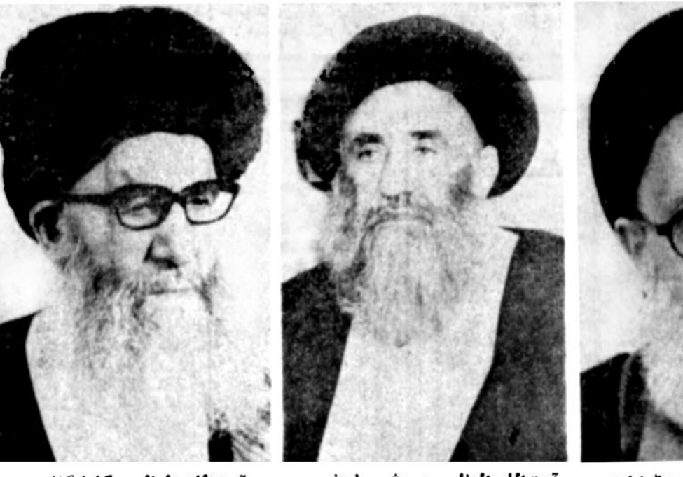
آیت‌الله العظمی شریعت‌مداری، آیت‌الله العظمی مرعشی نجفی، آیت‌الله العظمی گلپایگانی