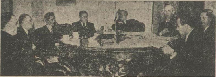
در این عکس آقایان وزیر اقتصاد ملی و دکتر دفتری و رستار هنگام مذاکره با نمایندگان بازرگانی دولت شوروی دیده می شوند