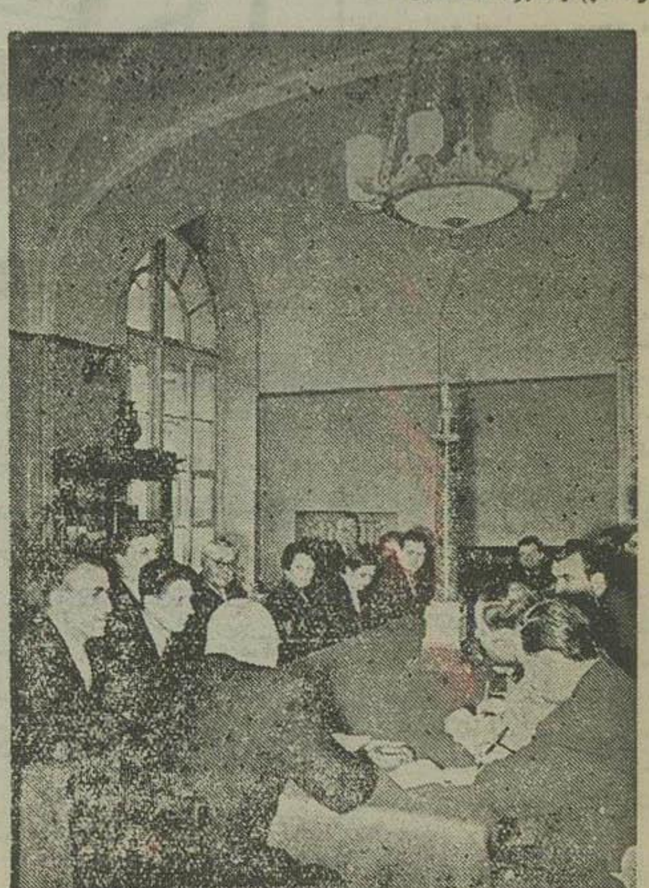
آقای ... یولیانف معاون دانشگاه لنینگر که آمدی گفت ما کیفیت تحصیل اهمیت می‌دهیم... کتابخانه بیشتر مطالعه کنند.

روزنامه نگاران در هر جا و در هر محل هر کس و هر شخصی را کبر می‌آوردند... سوالی می‌پرسیدند... جواب می‌دادند... آنها نظر میدادند.