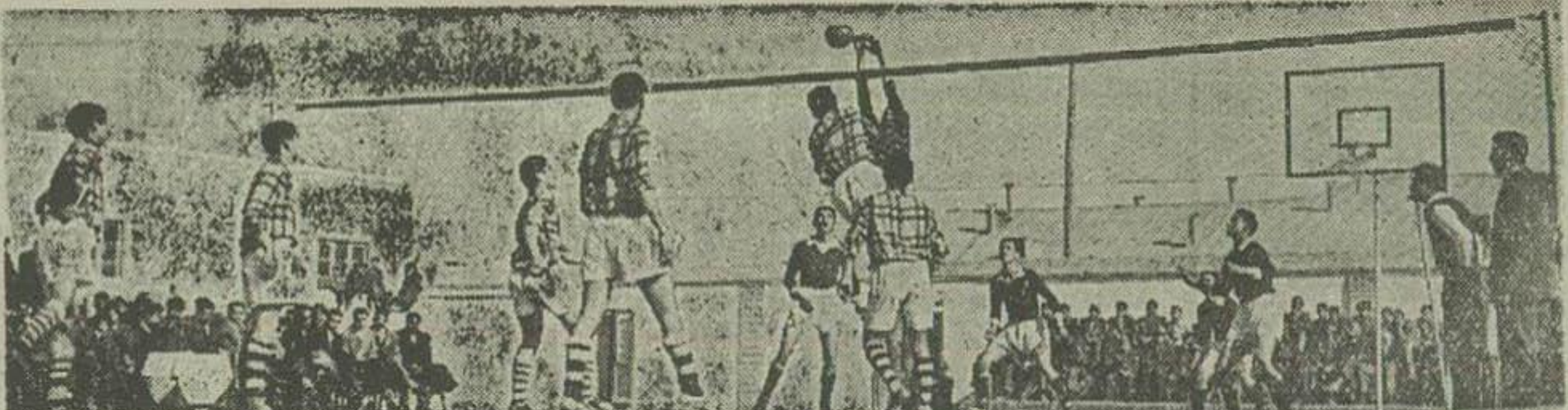
خبرنگار ما از مشهد مینویسد:

چند روز قبل بدعت اداره تربیت بدنی خراسان مراسم قرعه کشی مسابقات والیبال و بسکتبال دبیرستانهای پسرانه مشهد که در آن ۳۶ تیمته از چهارده دبیرستان نام نویسه و شرکت کردند بعمل آمد و مسابقات مقدماتی والیبال در قسمت دوره اول و دوم دبیرستانها بطور جداگانه بتر نظر اداره تربیت بدنی در روز ششگانه مهران آغاز گردید.