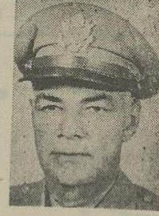
سر تیب زهر من رئیس هیئت مستشاران نظامی