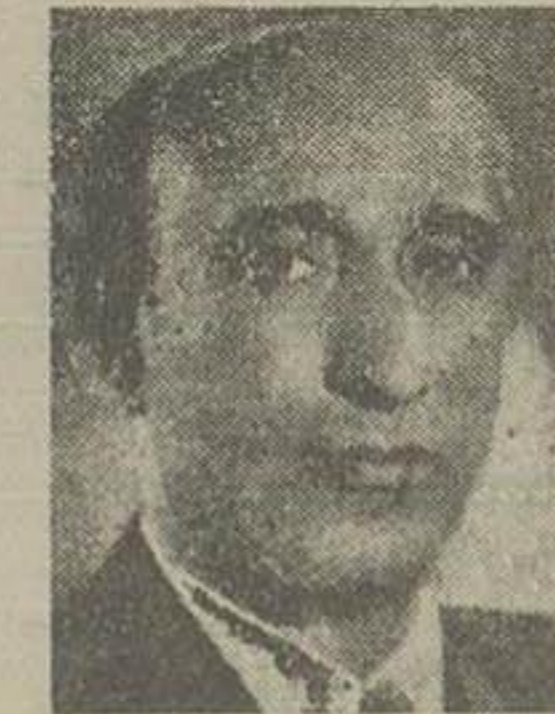
نصرت الله نادرخانی نزدیک مرادشدا پاتاچ کل بانک ملی ایران

امروز در گردیدورهای بهارستان و در جلسات خصوصی نمایندگان مجلس شورای ملی در این زمینه بود. بطور کلی معارف و دستجات مختلف عقیده داشتند با توجه باینکه اکثریت بآراء و اختیارات موافق است و آقای نخست وزیر نیز مورد اعتماد مجلس و مردم میباشد لذا در جلسه علنی فردا لایحه مورد تصویب خواهد رسید اما سواى این نظر عمومی و کلی عقاید و آراء مخالف موافق نیز دانها مورد بحث و گفتگو بود و اخیر تکار پارلمانی ما برای آنکه این نظریات را منعکس سازد با سه نفر از نمایندگان که دارای سه عقیده مختلف هستند بدین شرح مصاحبه بعمل آورده است.