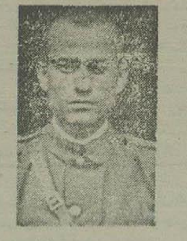
پاسبان دیروز و شهر دار امروز

برای اولین بار در ایران یک پاسبان شهر بانی از طرف انجمن شهر حسن کیاده بصیبت شهر دار انتخاب شد این پاسبان ۴۵ سال دارد و از اهالی بومی حسن کیاده می باشد رئیس کل شهر بانی ضمن تلگرافی تبریک خود بشهر دار حسن کیاده با اطلاع داد که جزو کارمندان شهر بانی باقی بوده پرونده اش محفوظ خواهد ماند