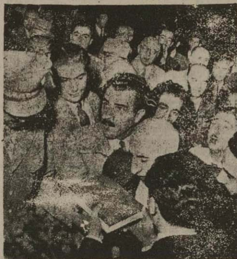
دکتر مصدق در میان انبوه جمعیتهای هوایی، از تبریز فرودگاه کریم میگذرد. تراز پلههای هواپیمای بالارود

جمعیت آذربایجان در فرودگاه اجتماع کرده بودند و دکتر مصدق بعنوان خدا حافظی سه بار به جمعیت تعظیم کرد.