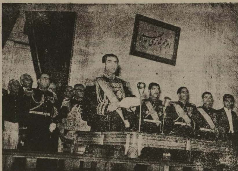
اعلیحضرت هاپون شاهنشاهی هنگام ایراد نطق افتتاحیه

هنگام گشایش دومین دوره اجلاس مجلس سنا با استظهار بیاری خداوند متعال دومین دوره اجلاس مجلس سنا را افتتاح مینمایم. جای بسی خوشوقی است که در نتیجه هم آهنگی بین مجلسین دولت و سنا نتایج تا ایلات عمری کانهای بلندی در راه استیضای منابع ایران برداشته شده در سلسله هشتم.