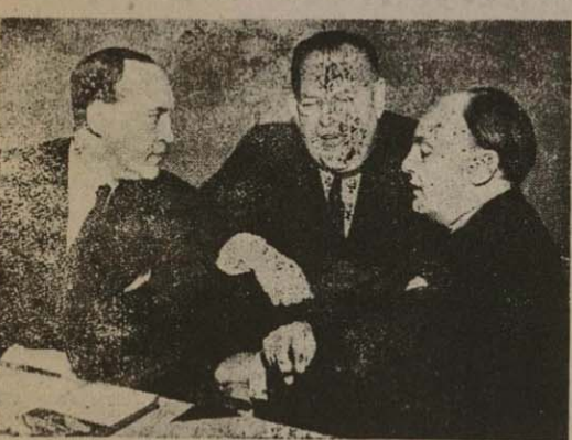
«چپ» نماینده دولت انگلیس در جلسات غیررسمی و «وسط» استیون نماینده امریکا (وسط) و «دست چپ» برای فراهم آوردن زمینه مذاکره میکند

عکس رادیویی دکتر مصدق امروز در ۴۰۰۰ متر ارتفاع انتشار یافت. نخست وزیر ایران را بواشنگتن دعوت کردند. نماینده امریکا هنگام استراحت دکتر مصدق در بیمارستان برای فراخ آمودن زمین سازش فعالیت میکند. دکتر اردلان تقاضا کرد جلد شورای امنیت روز پنجشنبه تشکیل شود. دولت انگلیس می گوید قضایا در خارج از جلد شورای امنیت تصفیه گردد. ایدن یکبار دیگر سیاست دولت کارگری حمله کرده است. اولین اثر قطع نفت ایران قیافه خود را در لندن نشان داد.