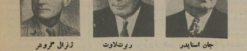
ژنرال گروتر، ربرت لاوت، جان استایدر

دولت اسپانیا برای شرکت در ارتش اروپای متحد فعالیت میکند