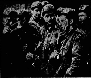
کارگران لهستان، گردانندگان اصلی بحران این کشور