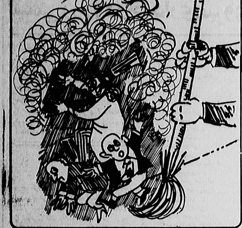
بازسازی ادارات ومسئولان

بازسازی ادارات ومسئولان. این بازسازی ادارات ومسئولان ، در این بازسازی ادارات ومسئولان.