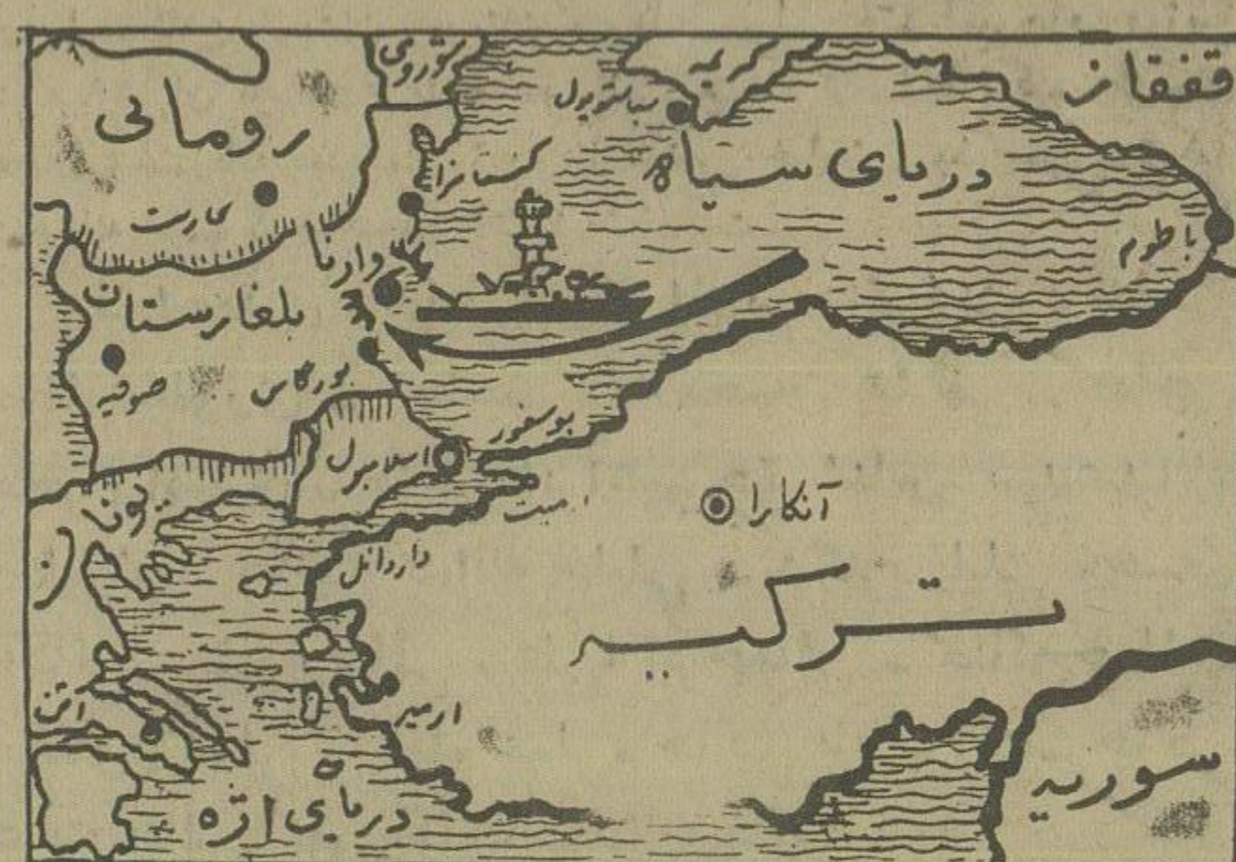
جهت حرکت و محل پیاپی شدن قوای شوروی در بلغارستان

مذاکرات نخست وزیران عراق - ترکیه و پاکستان پیرامون اوضاع خاورمیانه از بعد از ظهر دیروز آغاز شد کنفرانس بغداد که در حضور ملک فیصل و اسکندر میرزا تشکیل میشود در باره نتایج کنفرانس بیروت مذاکره خواهد کرد