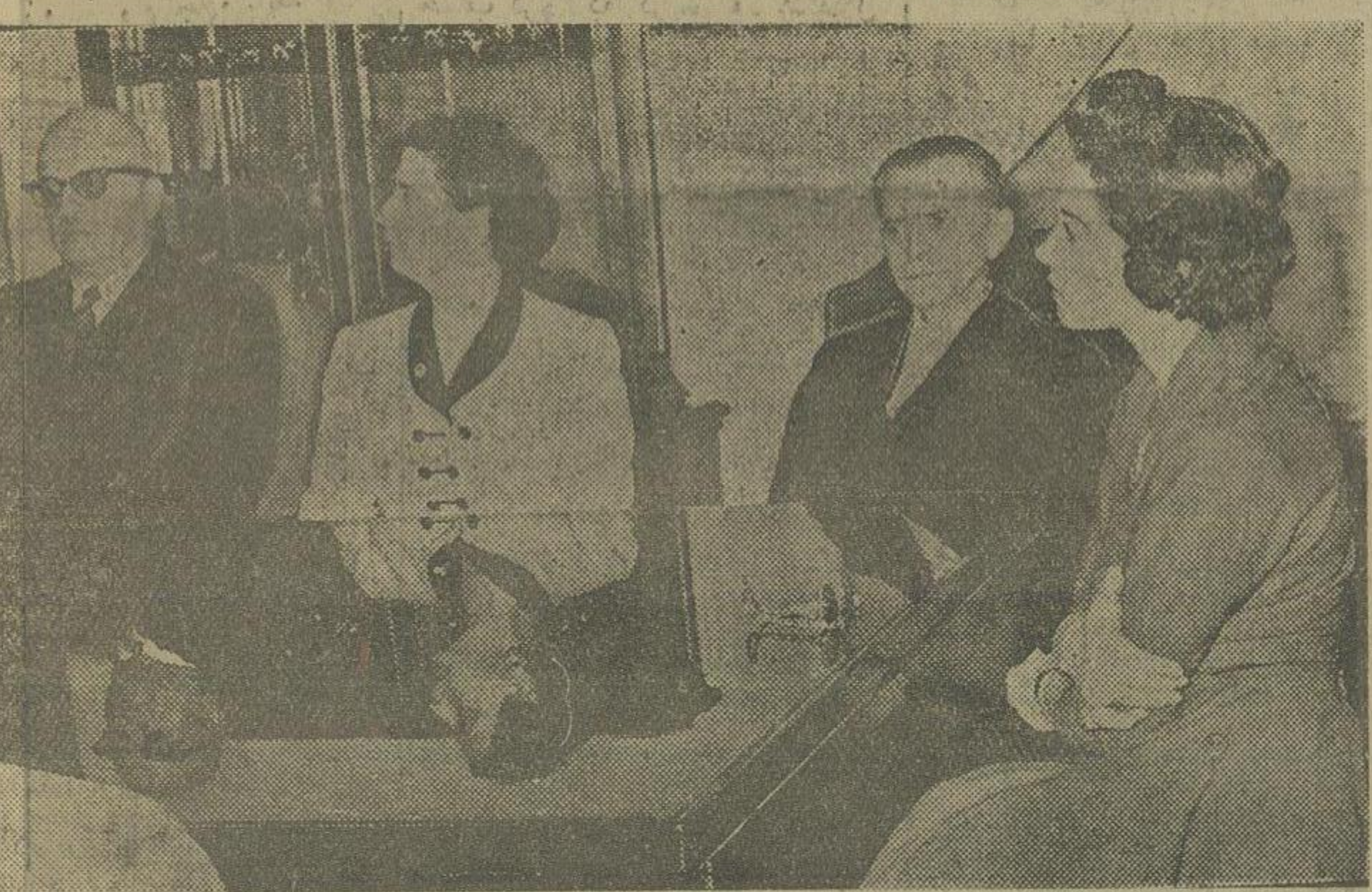
انتخابات دیشب در حضور والا حضرت شاهدخت شمس بهلوی انجام شد

بود است - آسوشیتد پرس - اعتصاب عمومی در سرتاسر مجارستان با شدت هر چه تمامتر ادامه دارد. خبر های تأیید شده حاکی است که در قسمت های غرب کشور پناهگاه و مخفی گاه هایی وجود دارد که هزاران نفر از افرادی مجهز به سلاحهای گوناگون در کمین هستند تا در موقع مناسبتری مبارزات خود را علیه سر بازن سرخ با شدت هر چه تمامتر آغاز نمایند. مردم علیه تبعید جوانان و خانواده های مجارستانی، روسه شوروی از طرف سر بازن سرخ اعتراض شدیدی نمایند حتی بچه های مدرسه نیز اینک در حال اعتصاب میباشند. شاگردان مدارس اخطار کرده اند که سراسر حاضر نخواهند شد مگر اینکه خواسته های ملیون برآورده شود. بقیه در صفحه سیزدهم