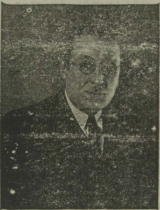
جناب اشرف آقان نخست وزیر